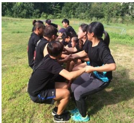
(圖 23)校內的戶外森林場有低空探索大家要合作完成