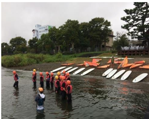
(圖 9)日本教練下水指導風浪板