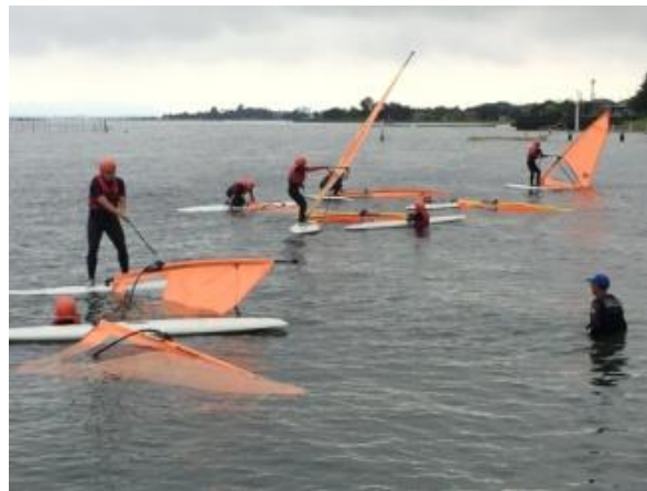
(圖 31)大家起帆適應平衡