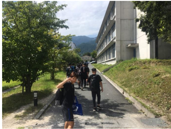
(圖 31)在成溪大學校園參訪