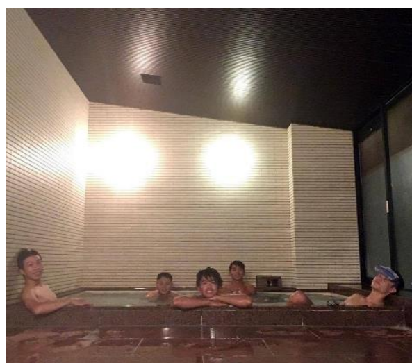
(圖6)回到招待所澡堂泡澡