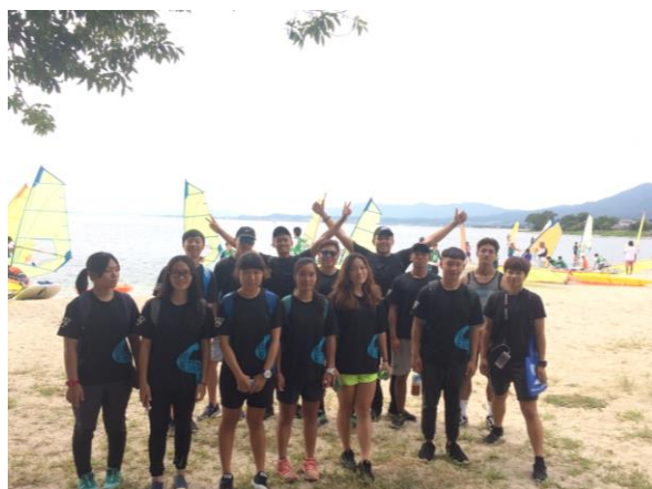
(圖 16)參觀成蹊大學學生水邊實習