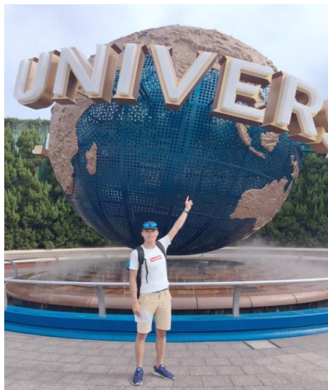
(圖 21)走訪日本大阪環球