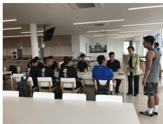
(圖 39)學弟妹參訪校園，幫忙做翻譯