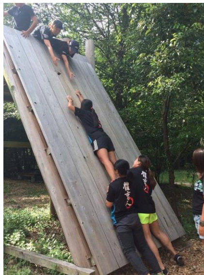
(圖 35)野外の森低空探索