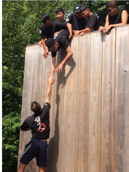
(圖 13)體驗團隊合作的活動