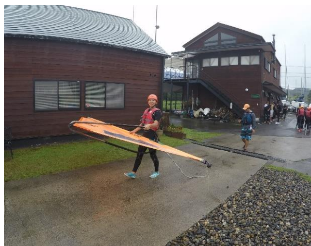
(圖5)風浪板課程事前準備