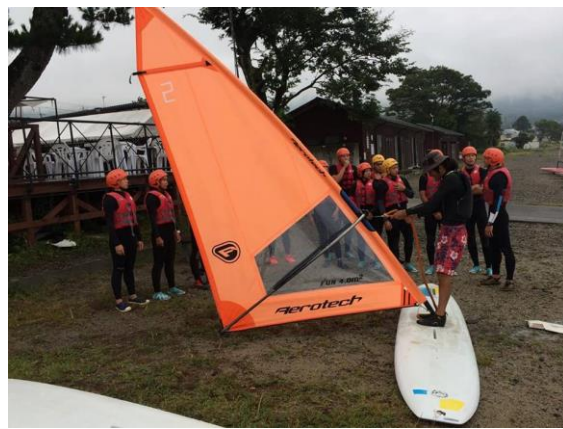
(圖 25)風浪板課程，教練動作講解指導