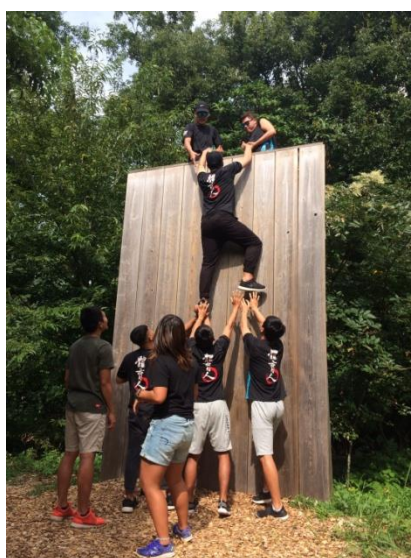
(圖 17)野外探索團隊合作