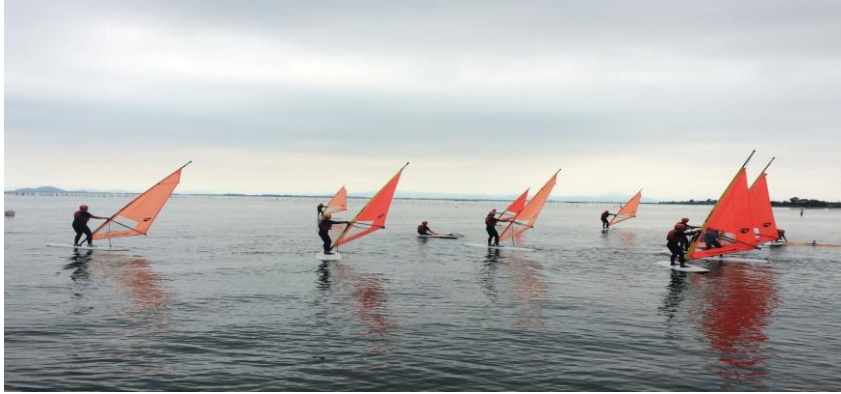
(圖 18)在琵琶湖開風浪板