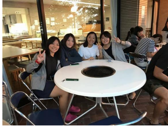
(圖 24)與日本學生老師們的歡迎會