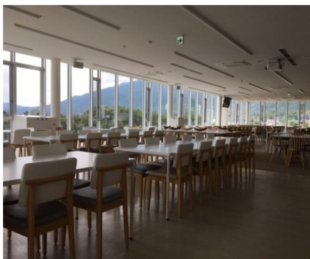
(圖 7)成蹊大學學生餐廳