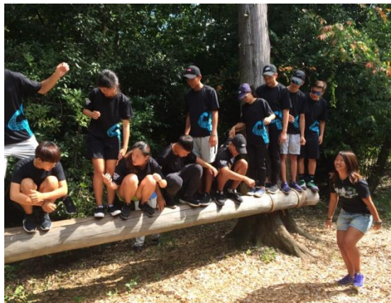
(圖 22)低空探索(獨木橋)