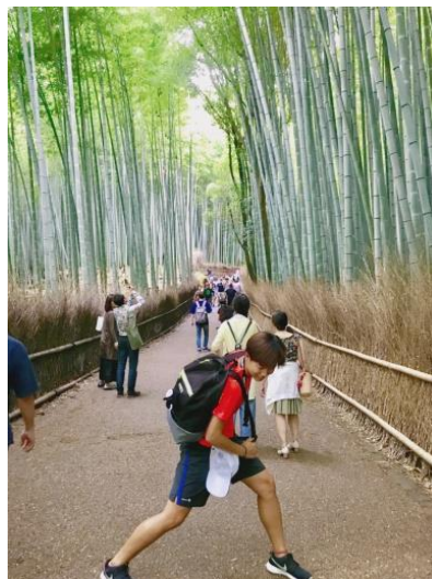
(圖 32)嵐山嵯峨野竹林