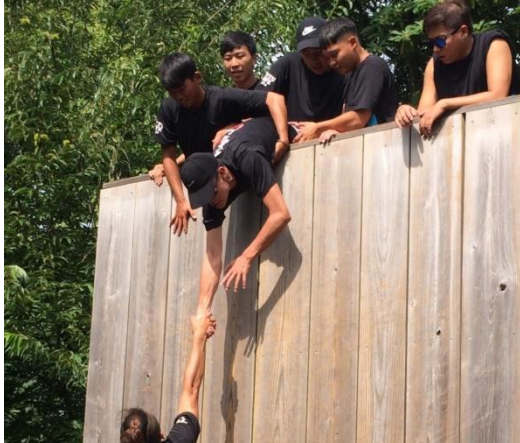
(圖 19)男生組體驗野外爬高牆