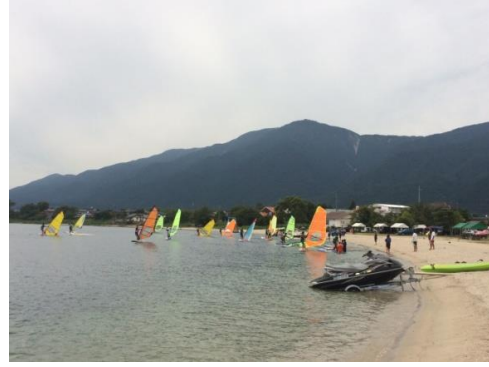
(圖 29)參觀水邊實習及器材