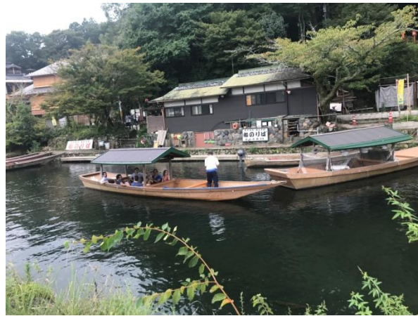
(圖 14)在嵐山觀賞到屋形船