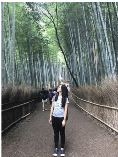
(圖 8)與嵐山竹林合影