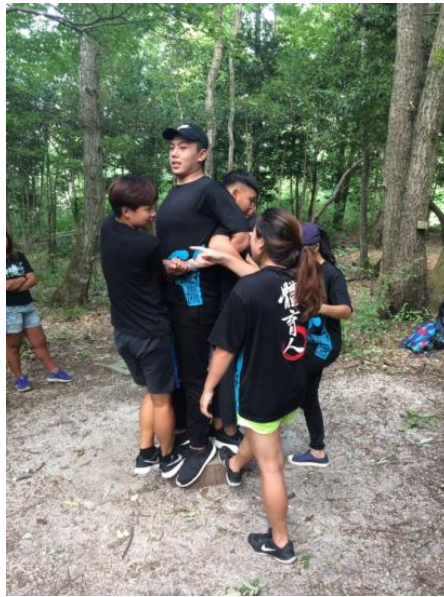
(圖 30)野外探索搶救日本島