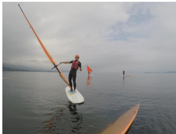
(圖 15)實際到琵琶湖操作風浪板