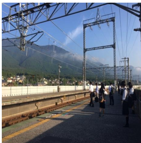
(圖 11)地鐵是每天代步的工具