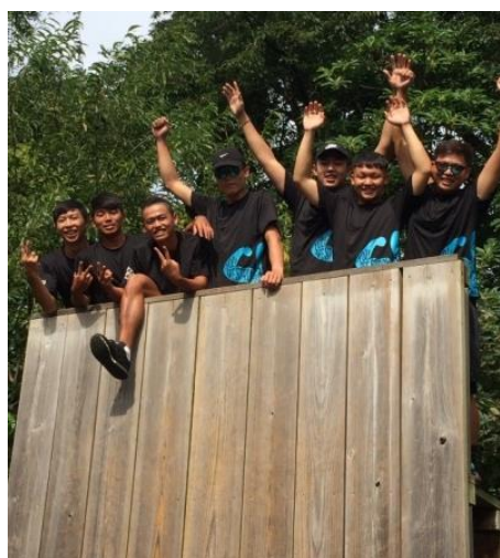
(圖4)野外探索爬高牆