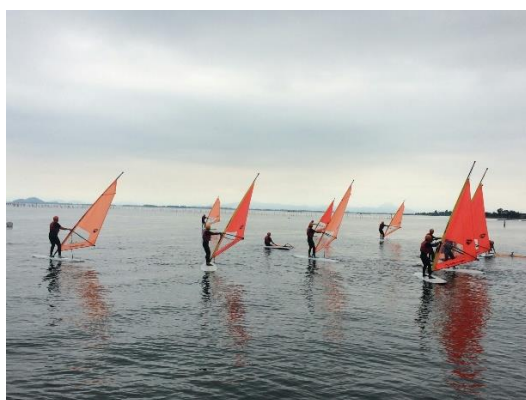
(圖 28)成功行駛風浪板的大家