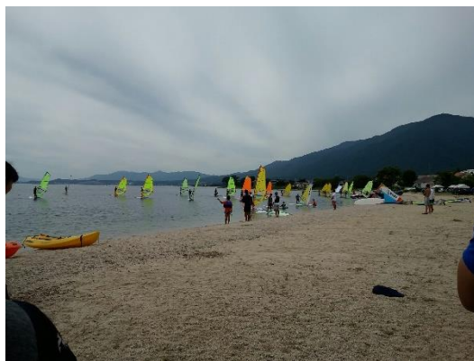
(圖 26)水邊實習教學觀摩