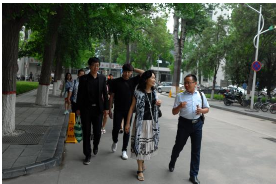
參觀河南師範大學與合影