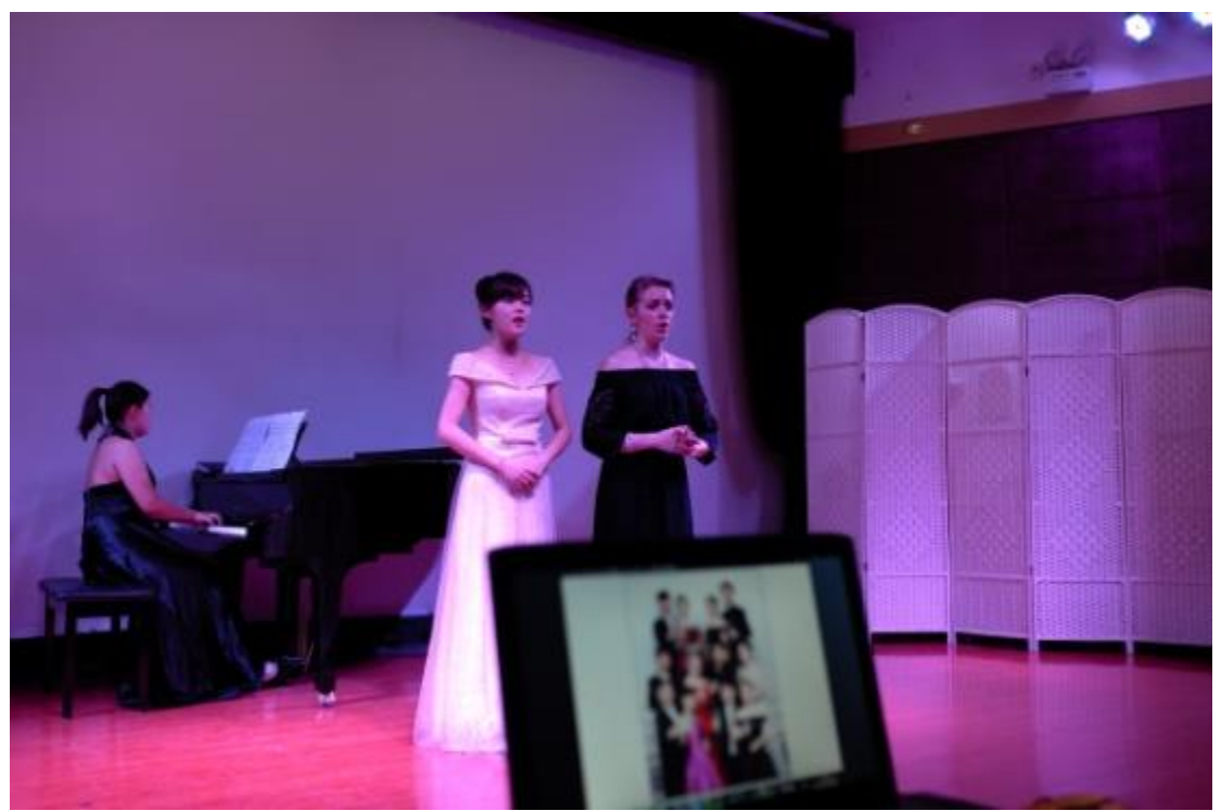
受邀參與鄭州大學音樂表演專業中白合作辦學項目告別音樂會