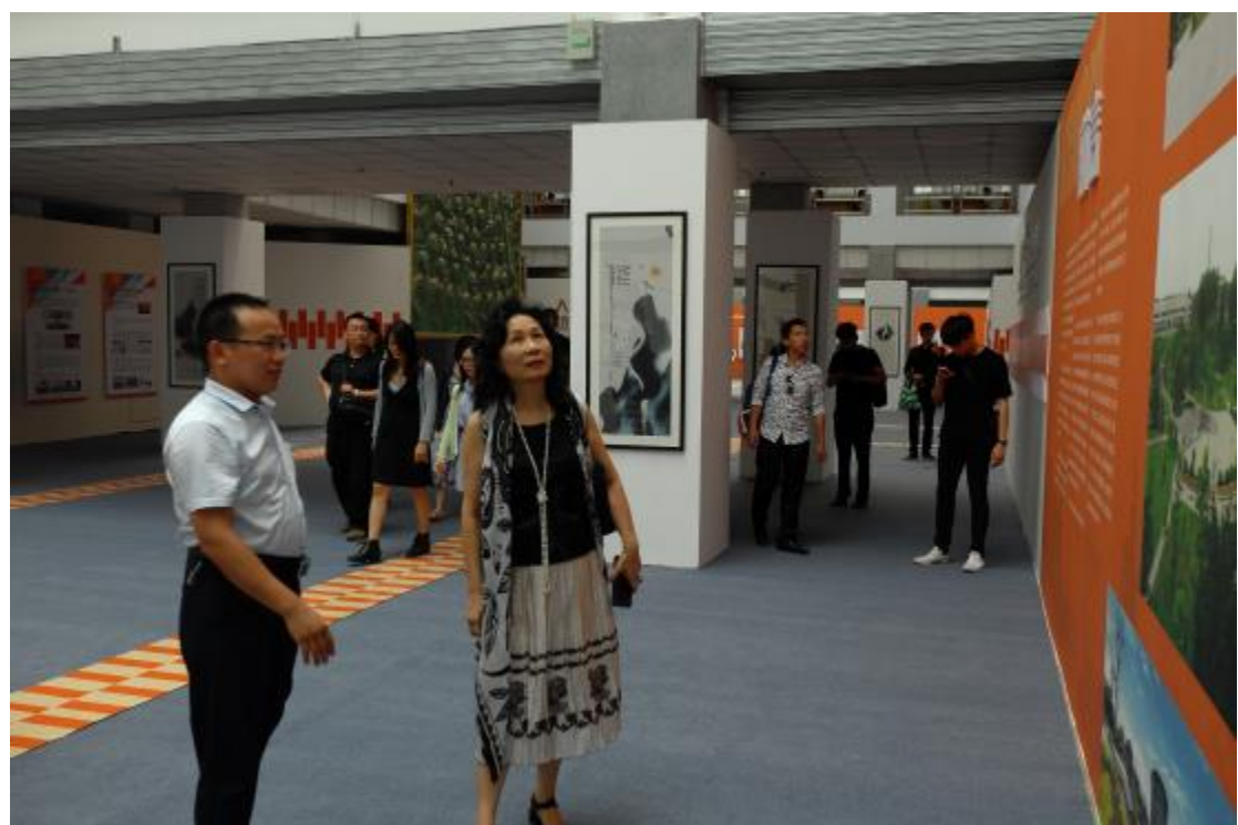
參觀河南師範大學