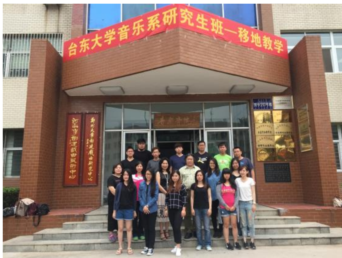
抵達鄭州大學音樂院並合影