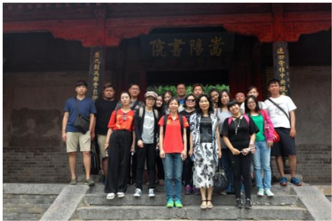
參觀嵩陽書院合影