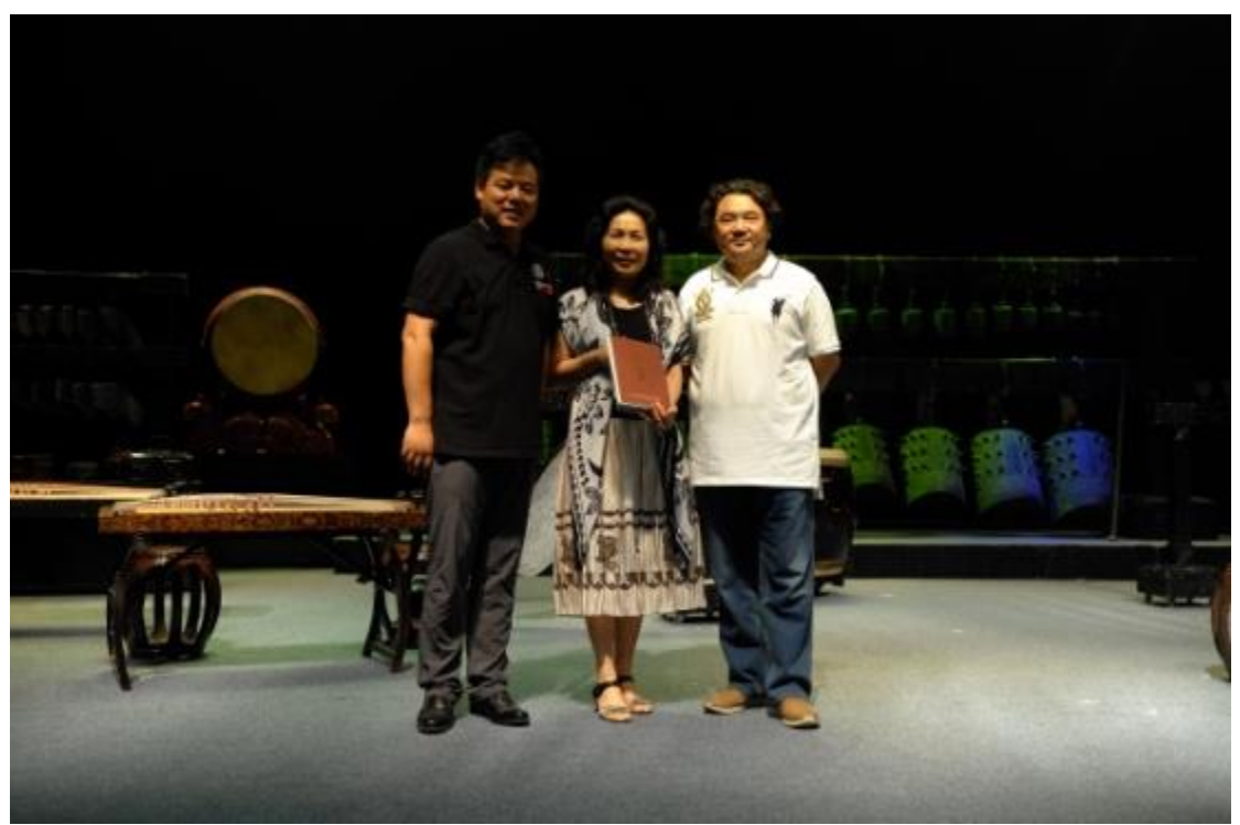
欣賞華夏古樂團演出並致贈台東大學校旗與感謝狀