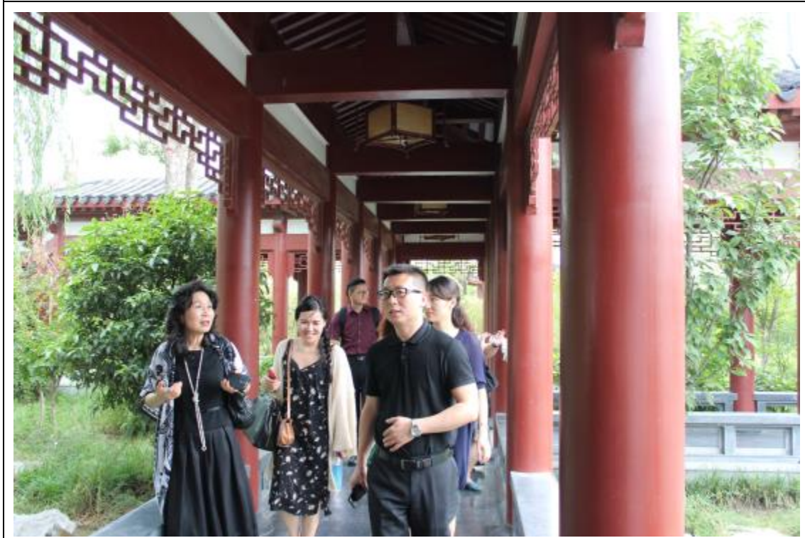
參觀鄭州大學西亞斯國際學院