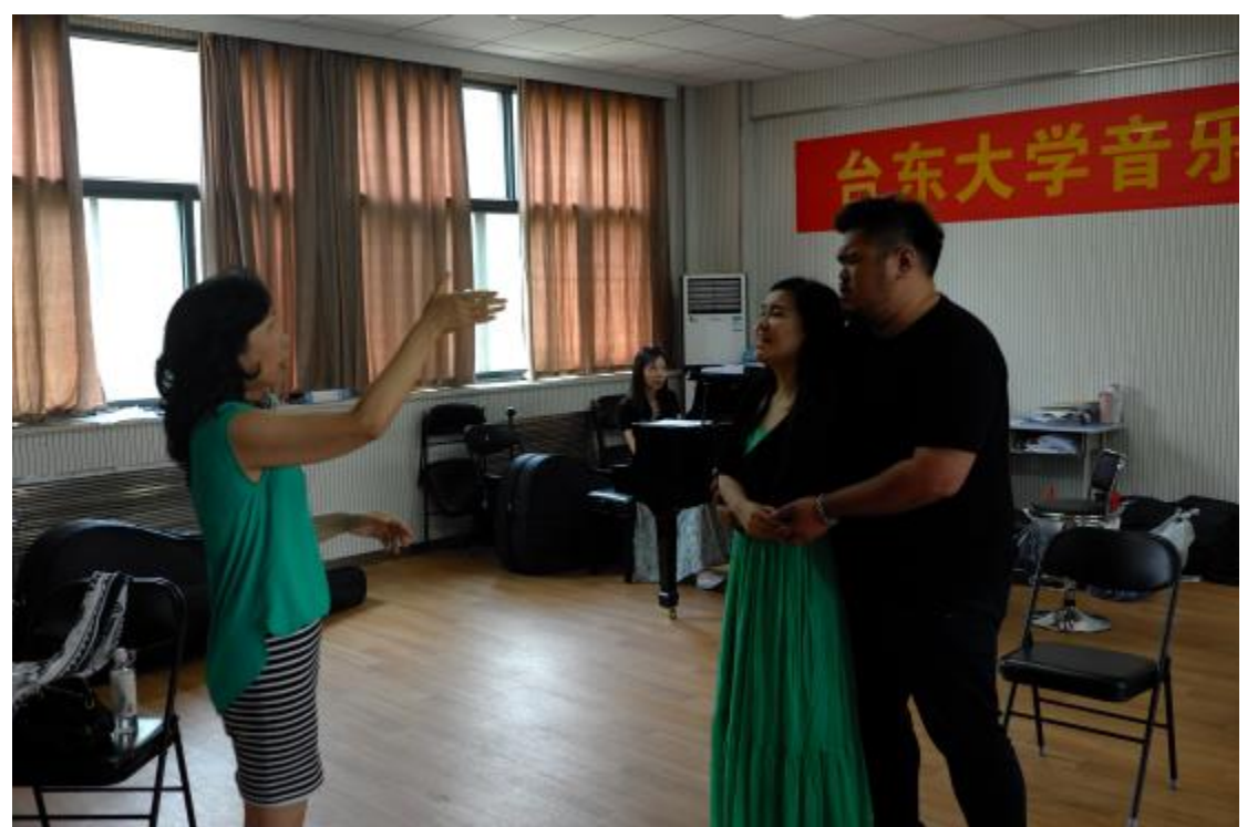
上課及分組指導練習