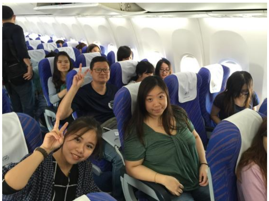
啟程前往桃園國際機場