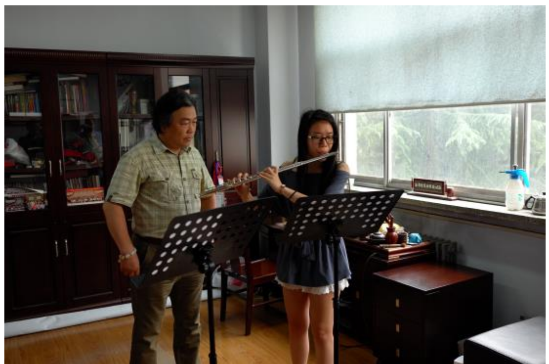
鄭州大學鞏院長親自上課指導