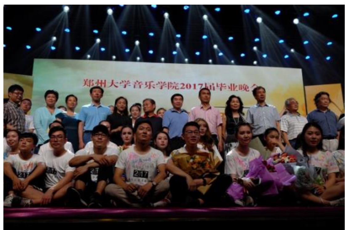
受邀參與鄭州大學音樂學院 2017 屆畢業晚會