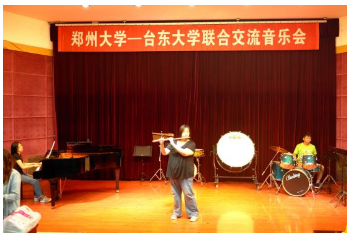
臺東大學與鄭州大學聯合交流音樂會總彩排