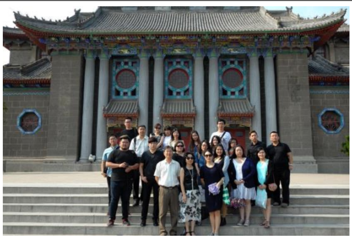
參觀河南大學並合影