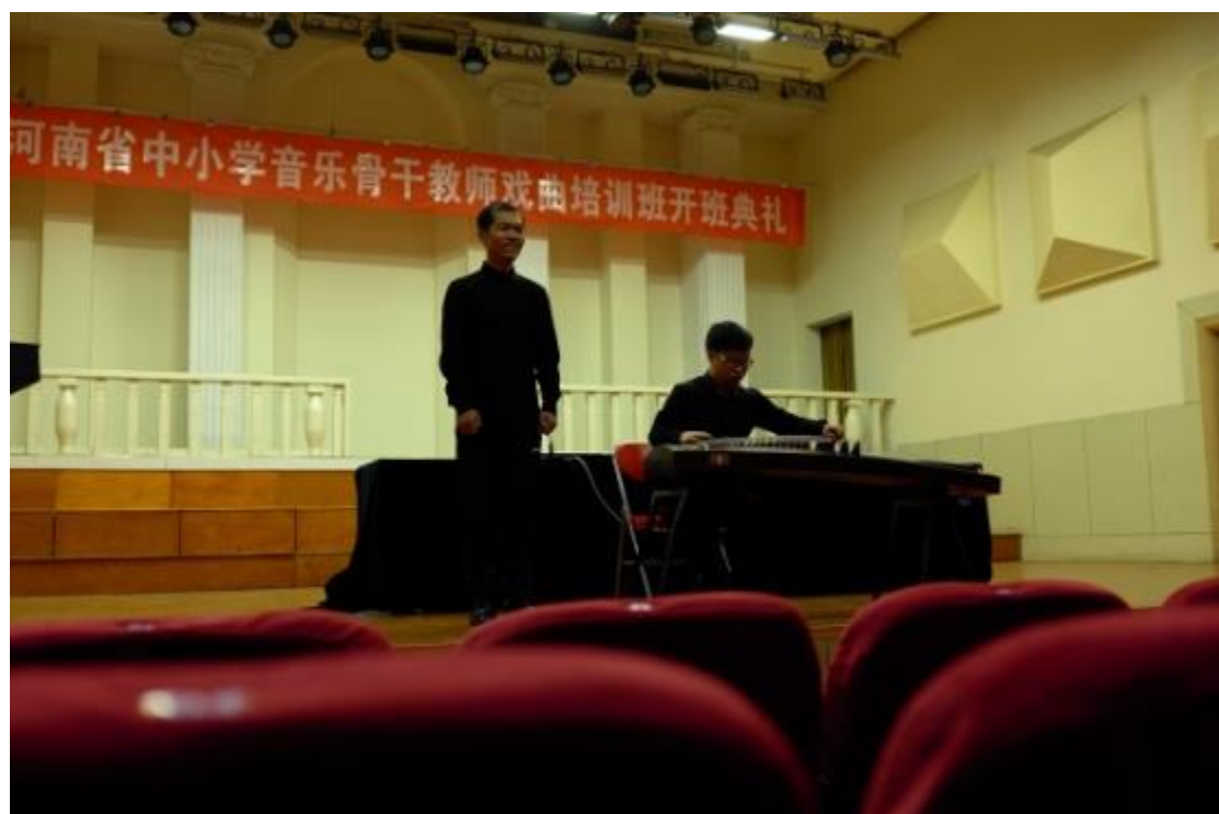
拜會河南大學及碩士生相互交流