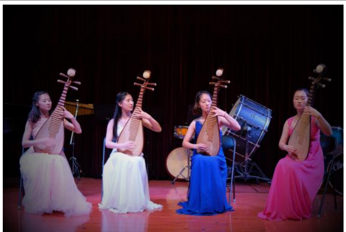
臺東大學與鄭州大學聯合交流音樂會正式演出