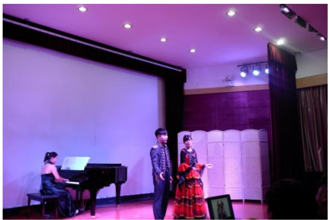
受邀參與鄭州大學音樂表演專業中白合作辦學項目告別音樂會