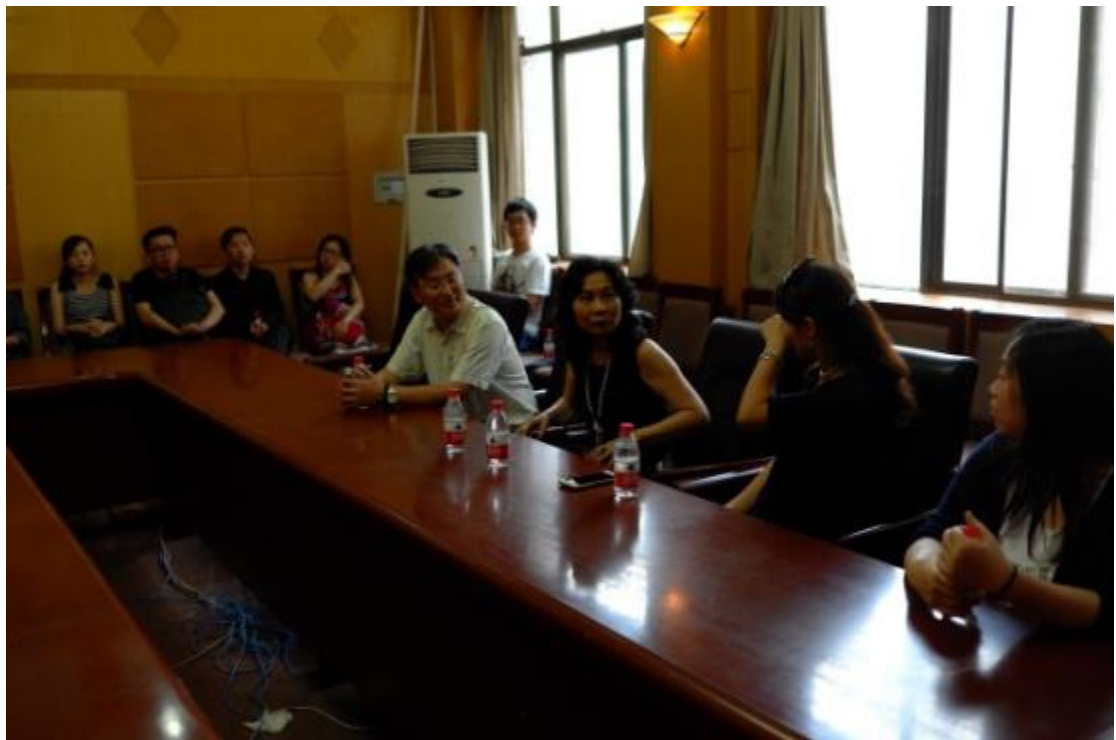
拜會河南大學及碩士生相互交流與座談