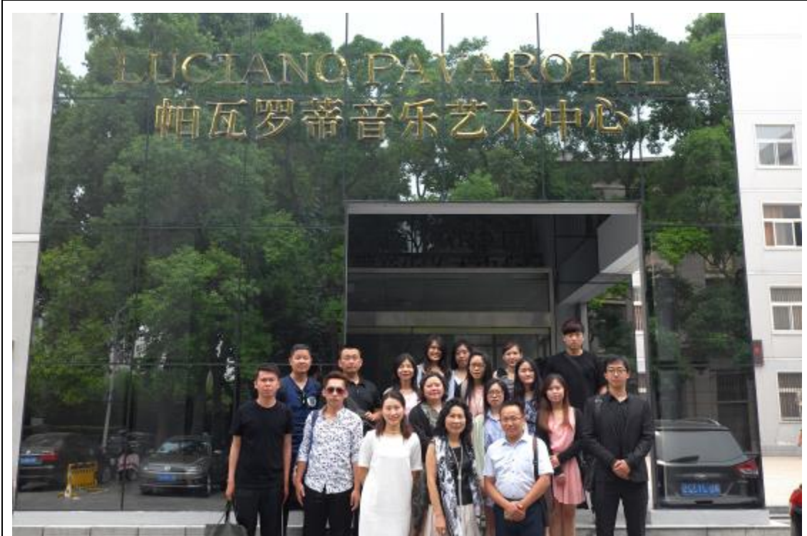
參觀河南師範大學與合影