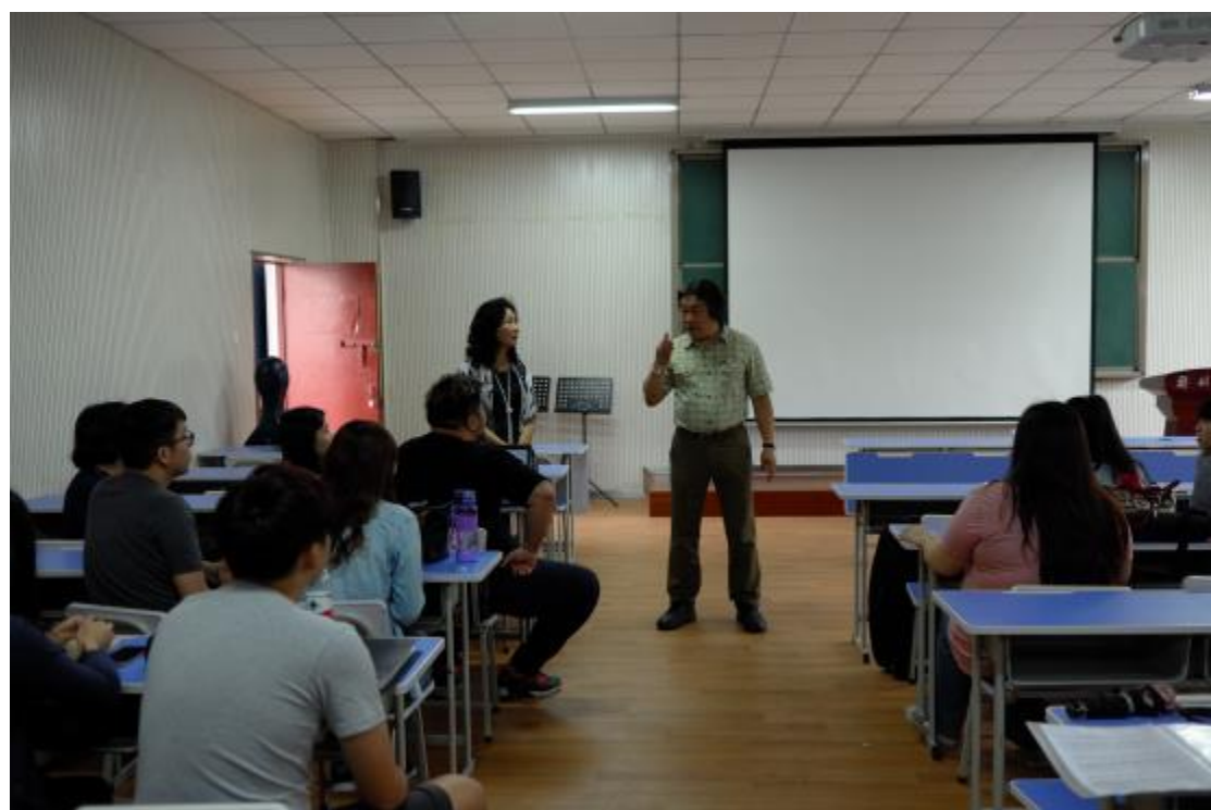
與鄭州大學互換主修教師交流上課合影