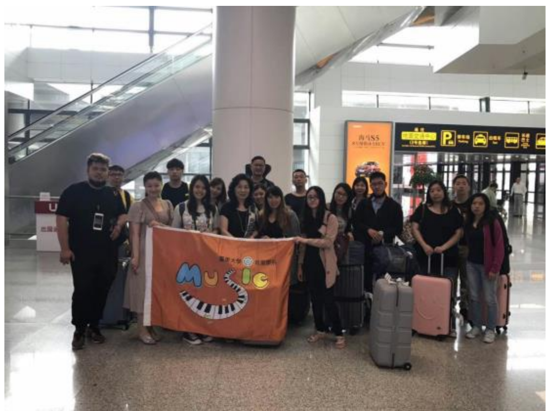
抵達新鄭國際機場