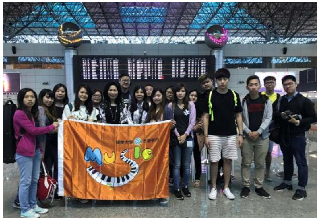
出發前往鄭州大學