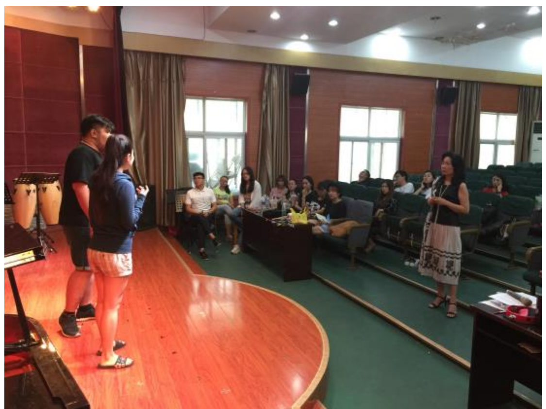
臺東大學與鄭州大學聯合交流音樂會總彩排