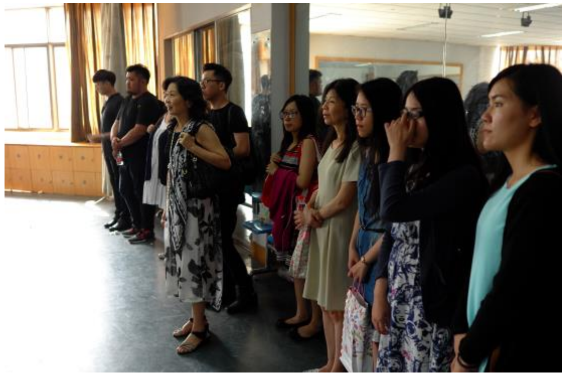
參觀河南大學上課情形