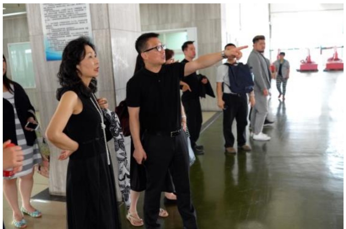
參觀鄭州大學西亞斯國際學院