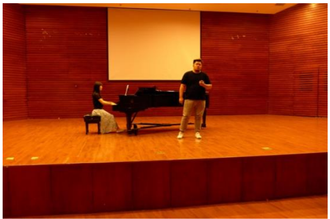
與鄭州大學西亞斯國際學院交流演出