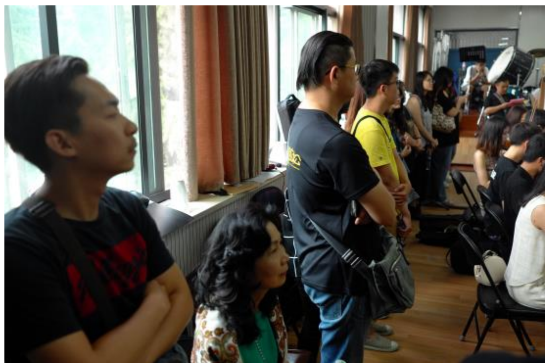
鄭州大學音樂學院管弦樂團交流演出