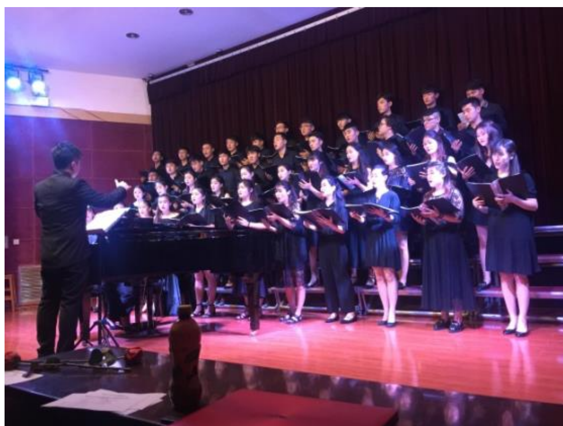
受邀聆聽鄭州大學音樂學院混聲合唱團音樂會演出