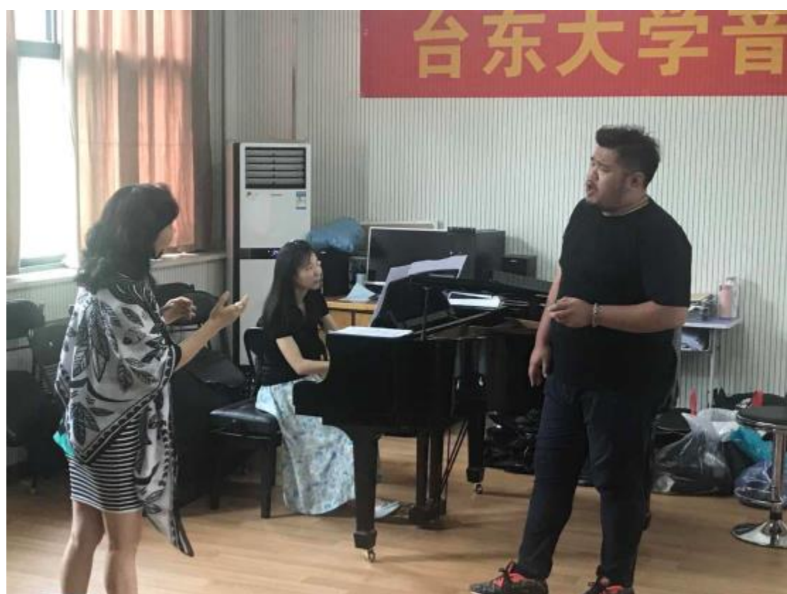
上課及分組指導練習