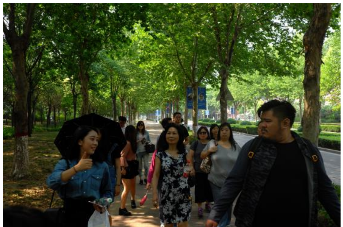
參觀鄭州大學新校區