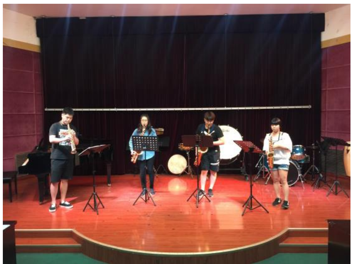
臺東大學與鄭州大學聯合交流音樂會總彩排