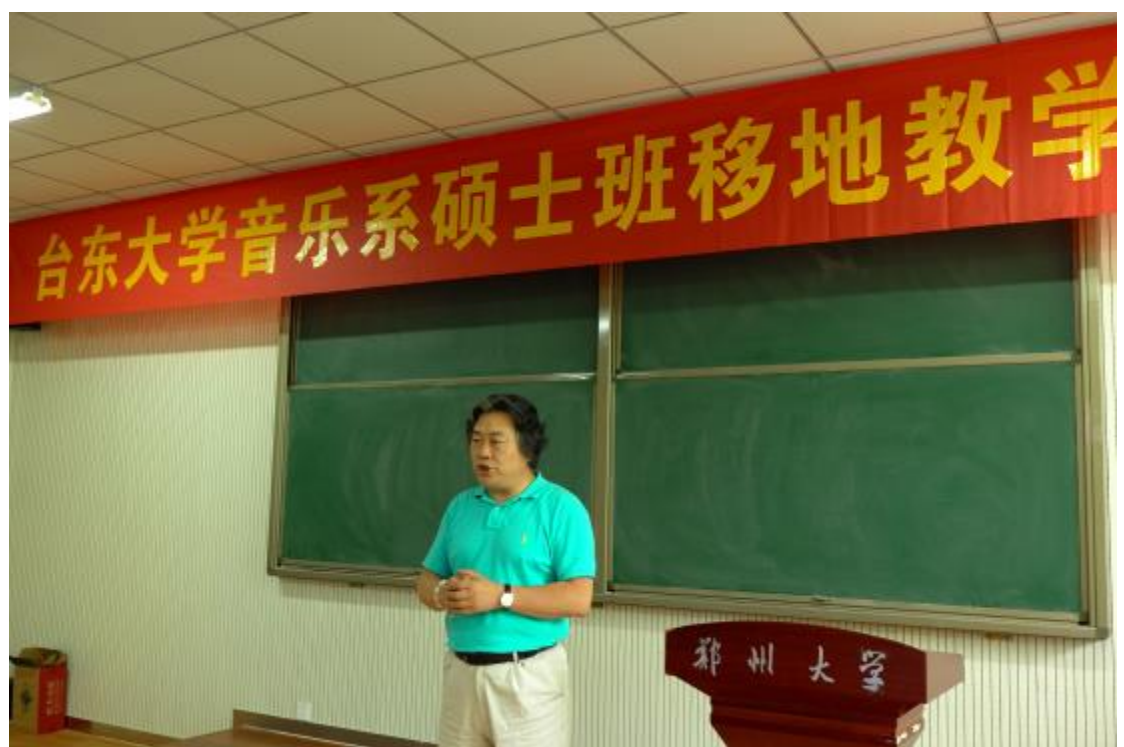
臺東大學音樂系碩士班移地教學開班典禮，鄭州大學音樂學院鞏偉院長致詞