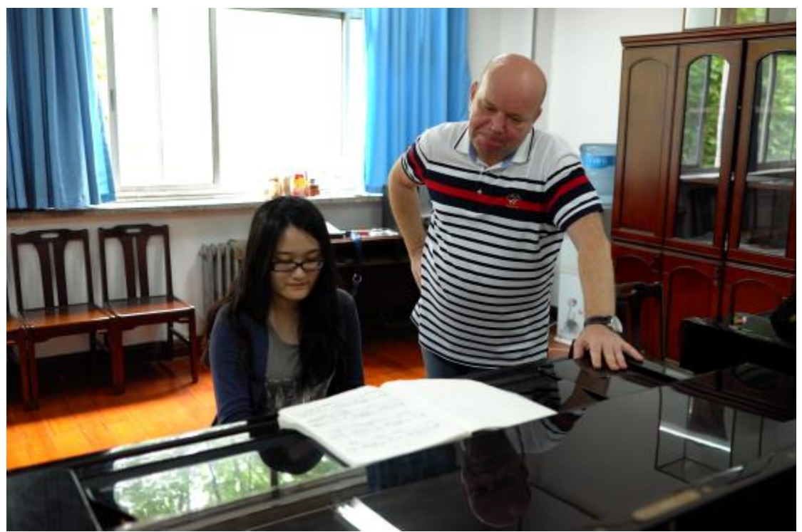
鄭州大學俄羅斯鋼琴主修教師交流上課