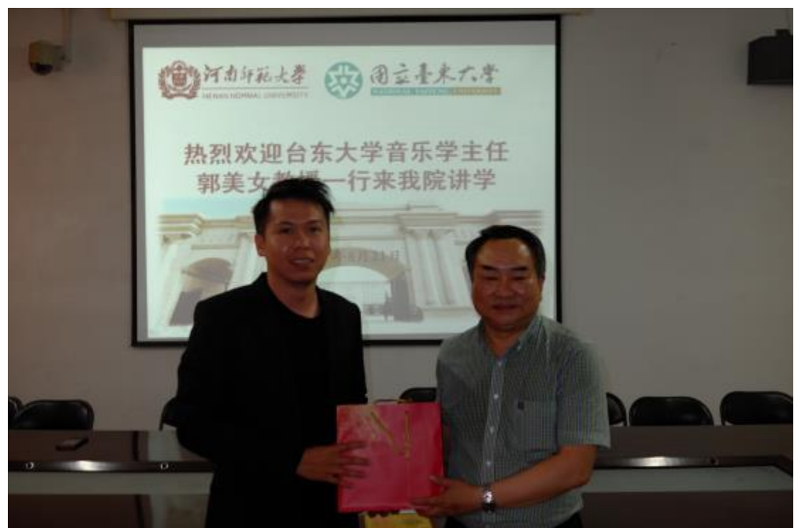
拜會河南師範大學與交流並致贈校旗及感謝狀