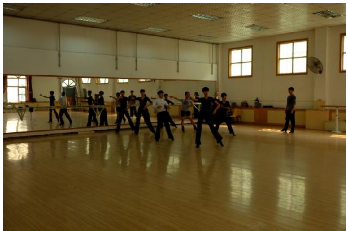
參觀鄭州大學西亞斯國際學院上課情形