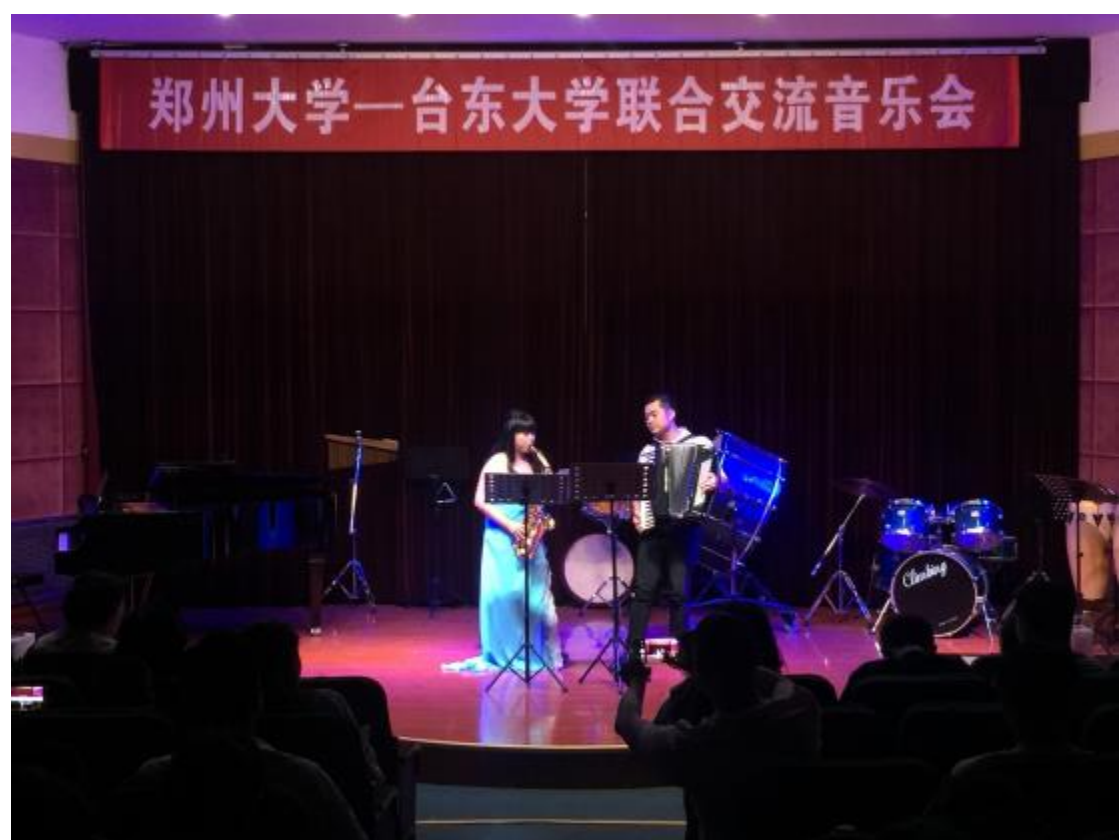
臺東大學與鄭州大學聯合交流音樂會正式演出