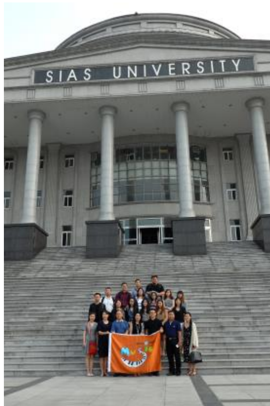
參觀鄭州大學西亞斯國際學院並合影