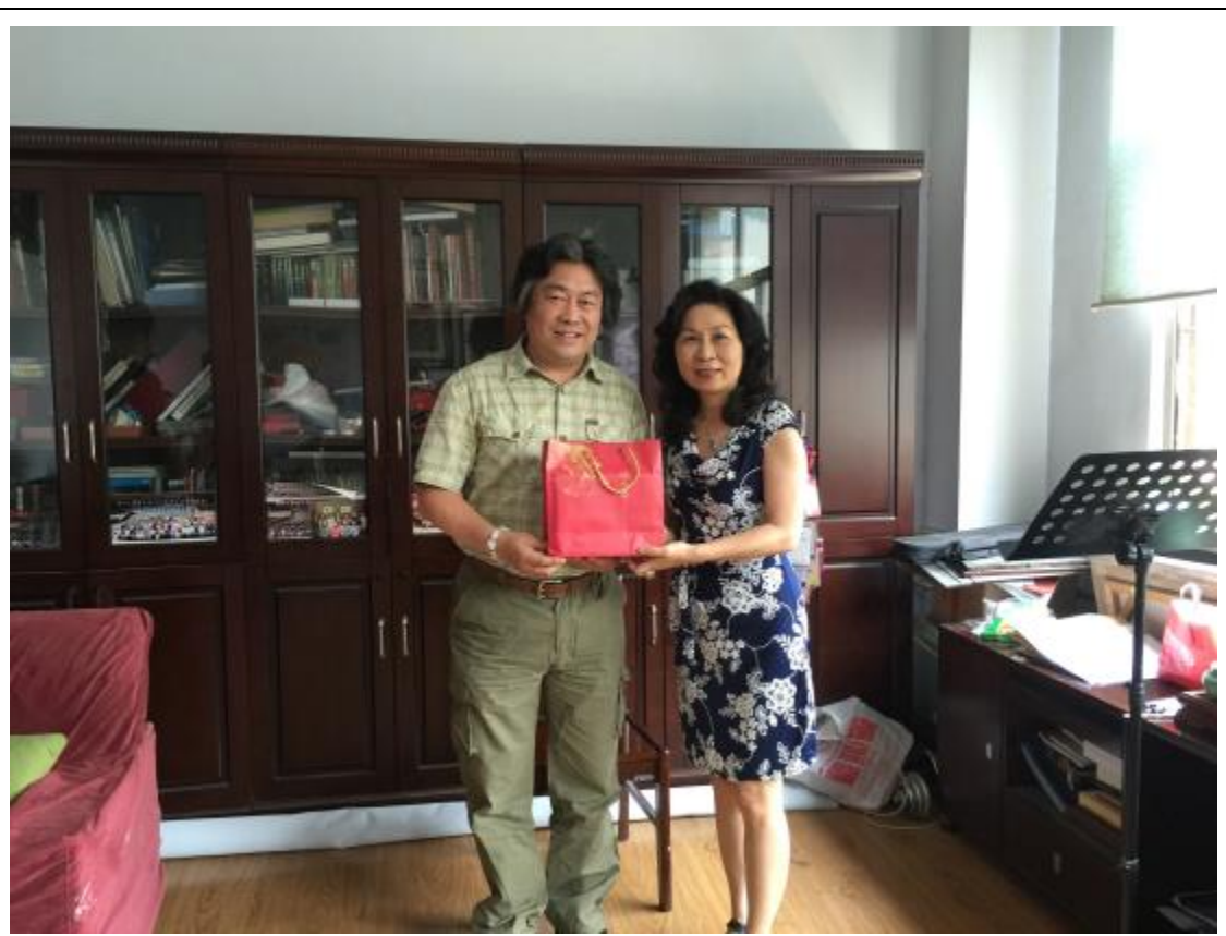
感謝鄭州大學音樂學院鞏院長 & Say Good Bye~