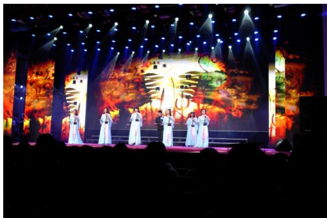
受邀參與鄭州大學音樂學院 2017 屆畢業晚會