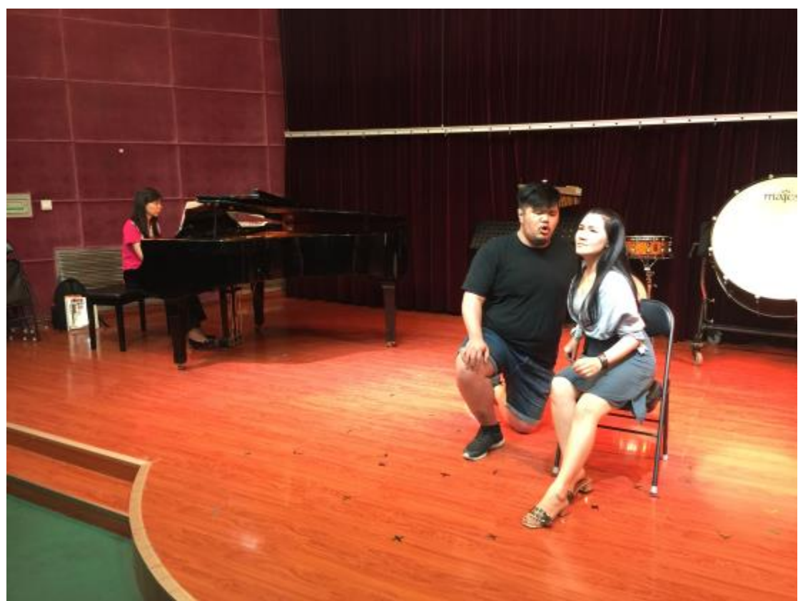
臺東大學與鄭州大學聯合交流音樂會總彩排