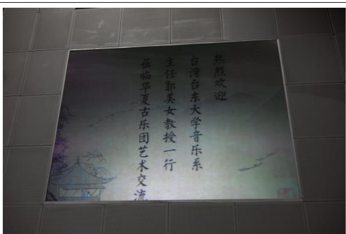
音樂系師生與華夏古樂團交流及互動