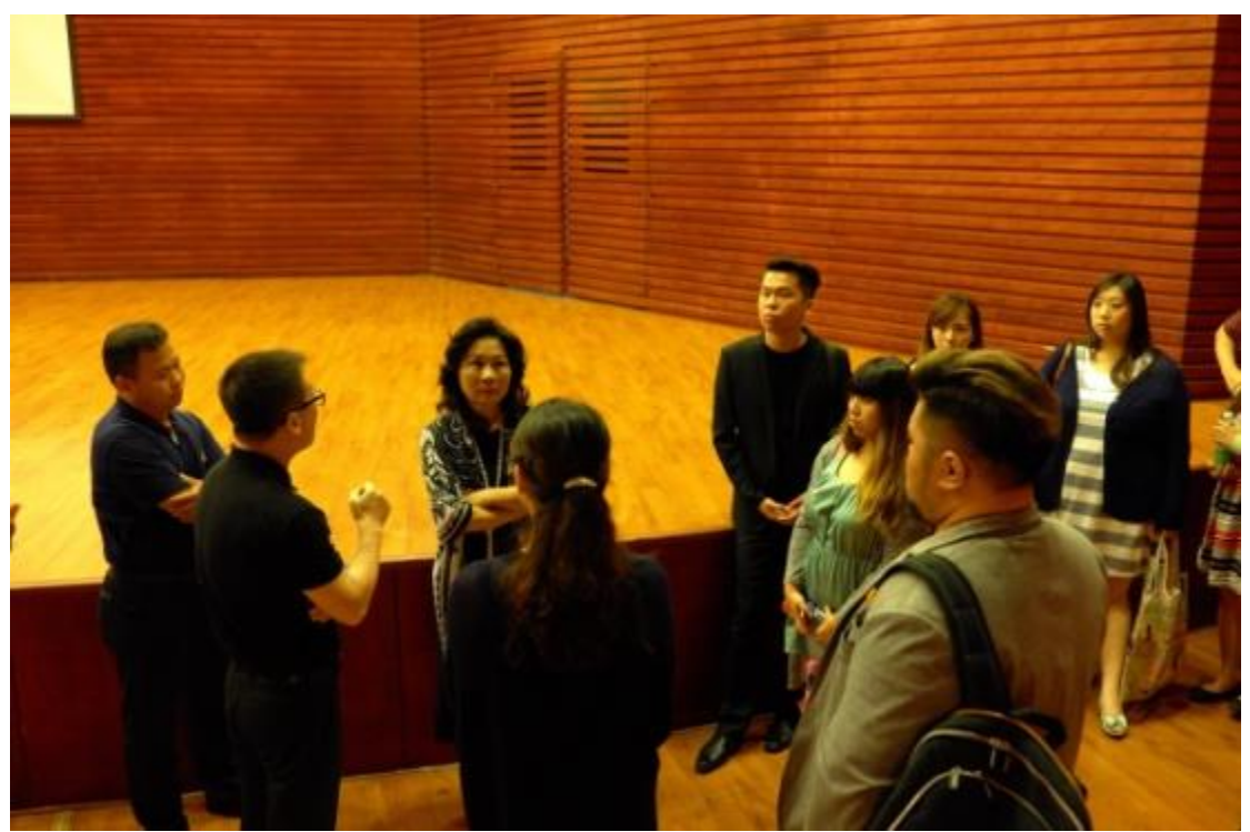
參觀鄭州大學西亞斯國際學院