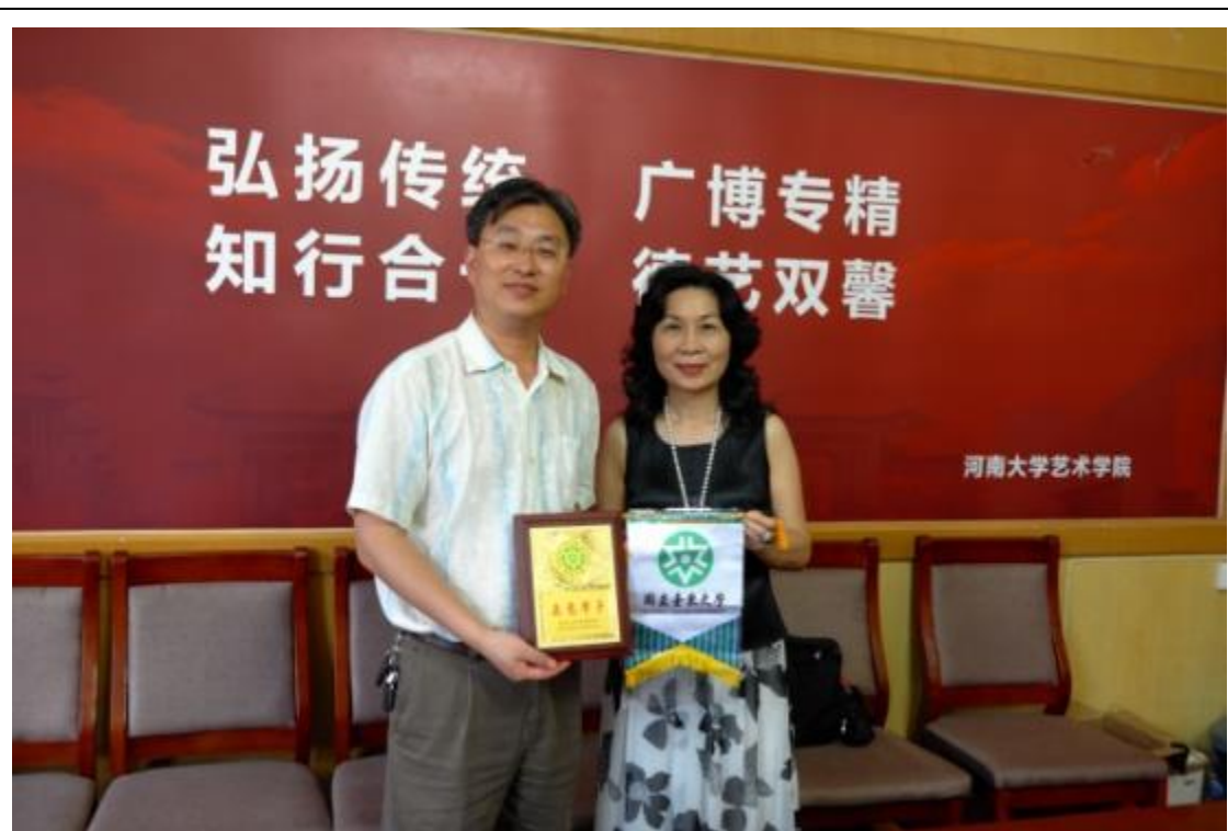
拜會河南大學與交流並致贈校旗及感謝狀