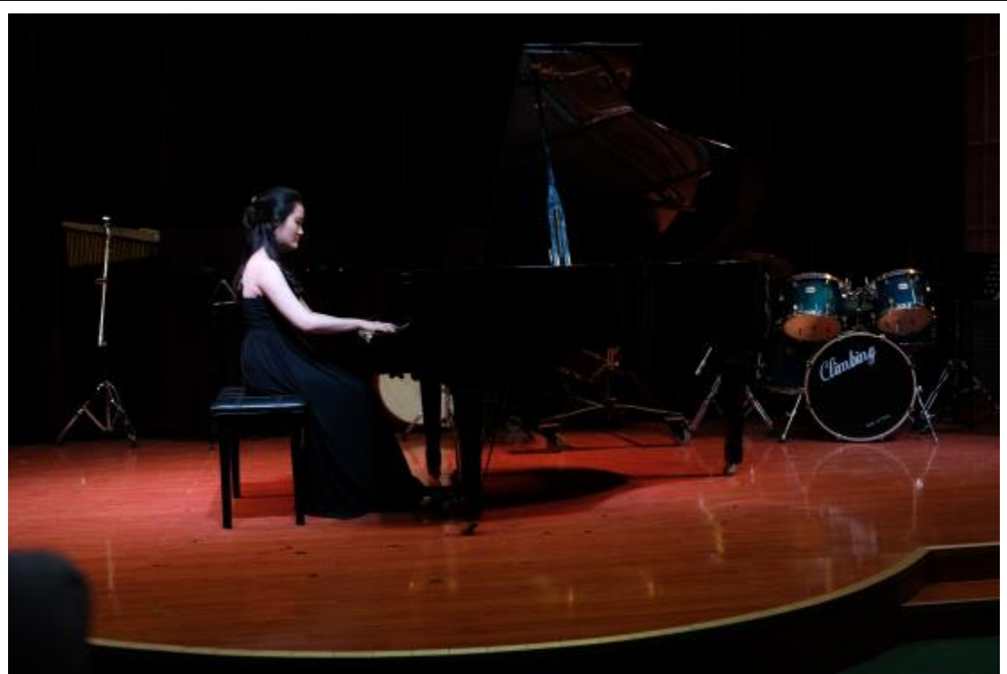
臺東大學與鄭州大學聯合交流音樂會正式演出