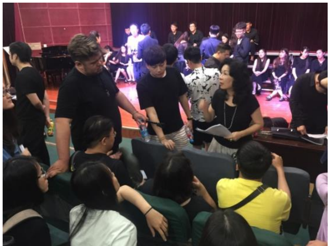
受邀聆聽鄭州大學音樂學院混聲合唱團音樂會演出