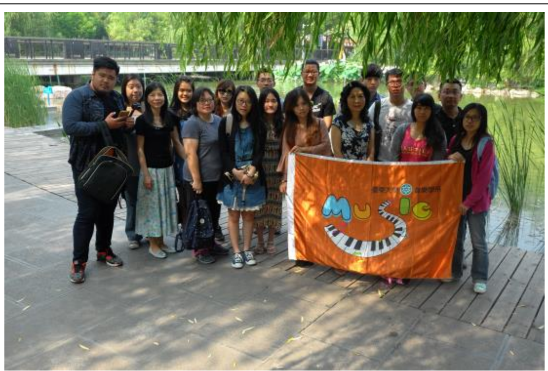
鄭州大學新校區合影