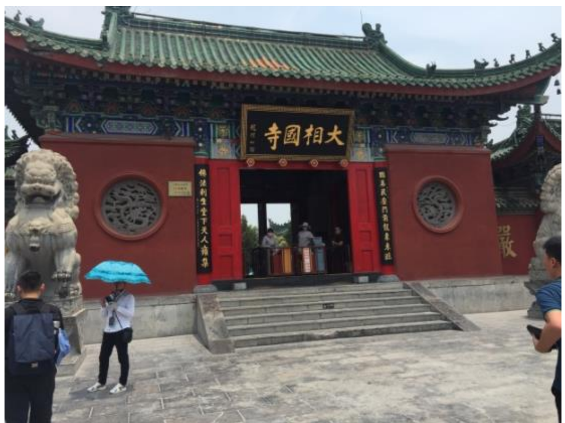
參觀開封清明上河園與相國寺