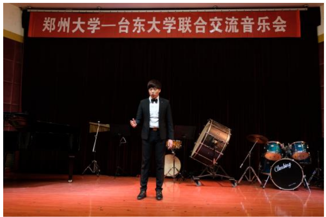
臺東大學與鄭州大學聯合交流音樂會正式演出