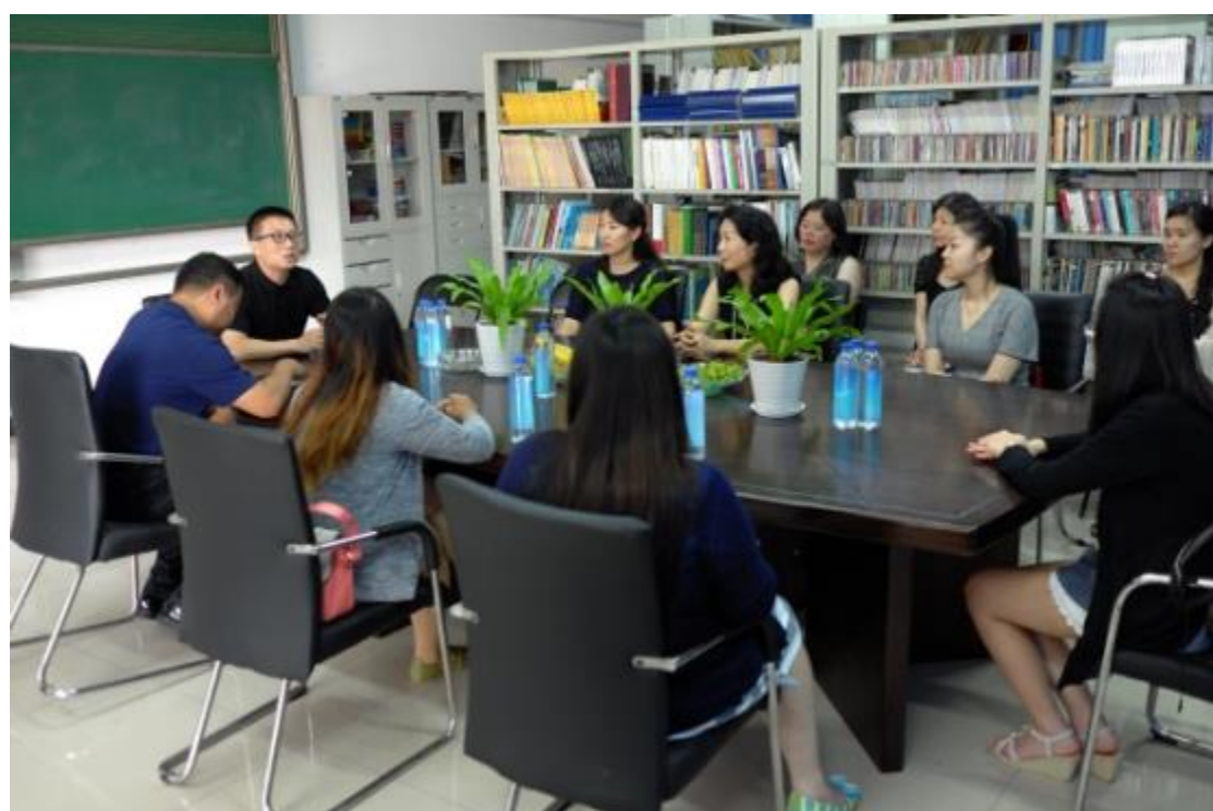
拜會鄭州大學西亞斯國際學院與交流座談