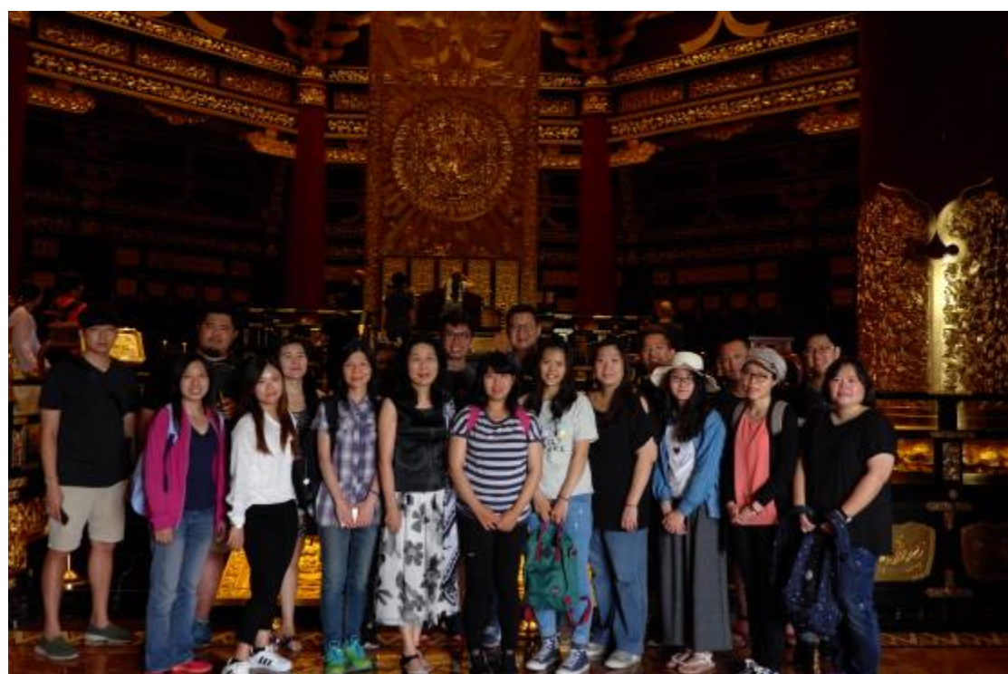
參觀洛陽天堂、明堂合影