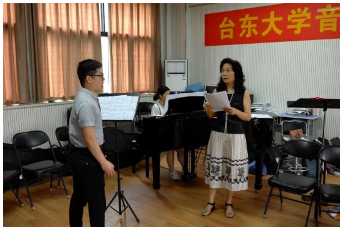
與鄭州大學互換主修教師交流上課