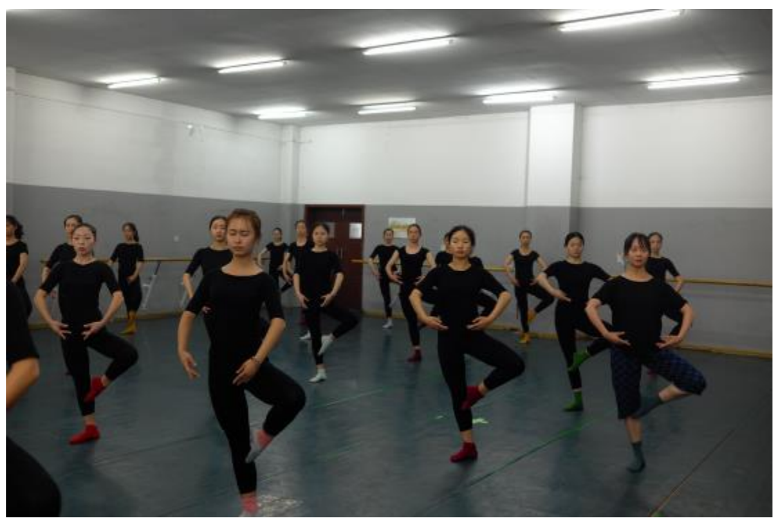
參觀河南師範大學上課情形