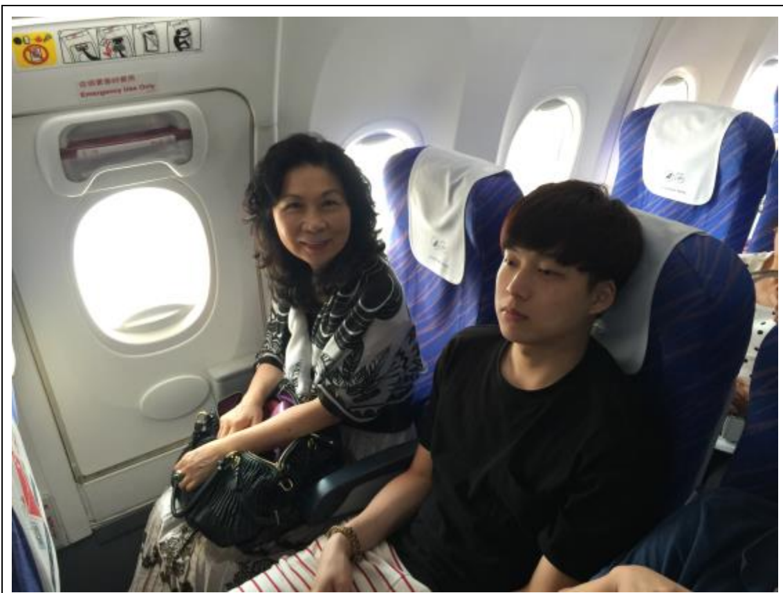
啟程前往桃園國際機場