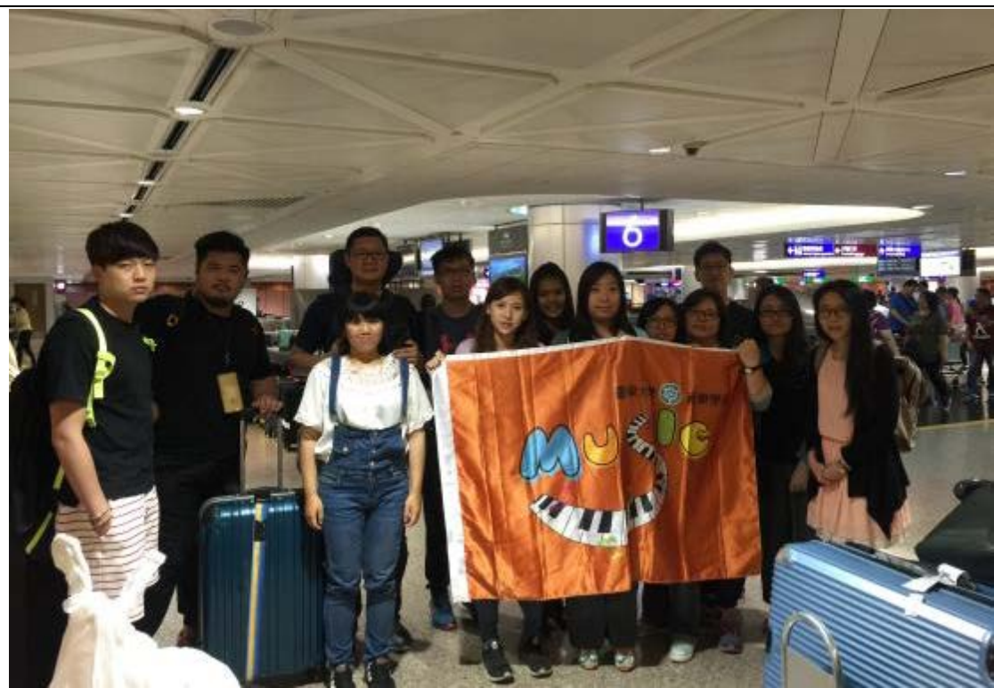
抵達桃園國際機場，平安回家～YA～