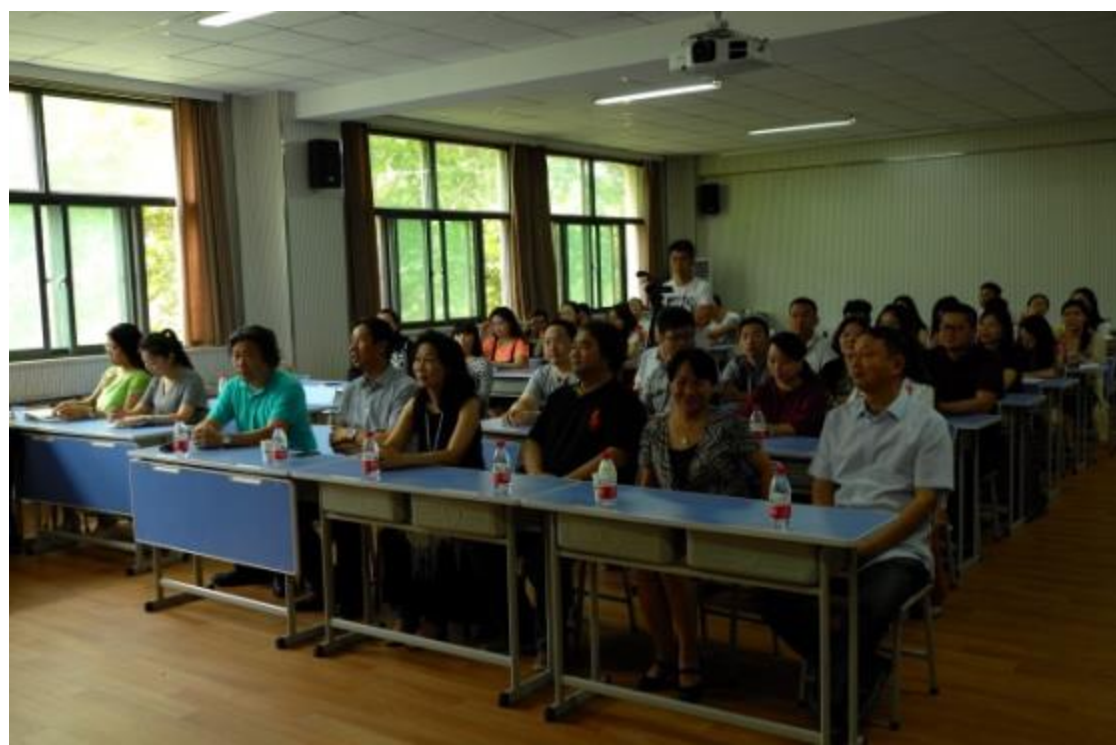
臺東大學音樂系碩士班移地教學開班典禮