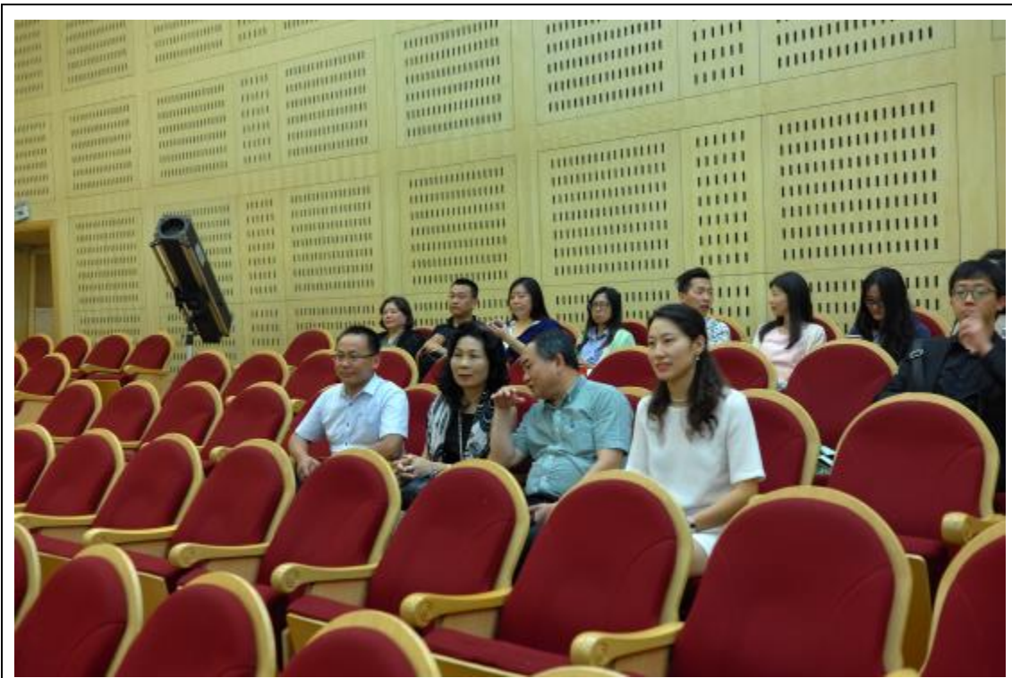
參觀河南師範大學上課情形