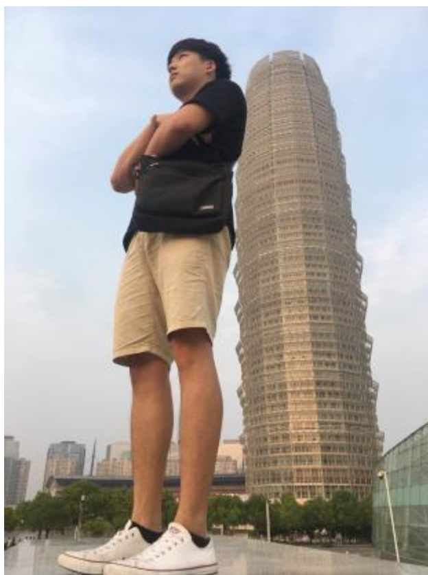
鄭州參訪與自由活動