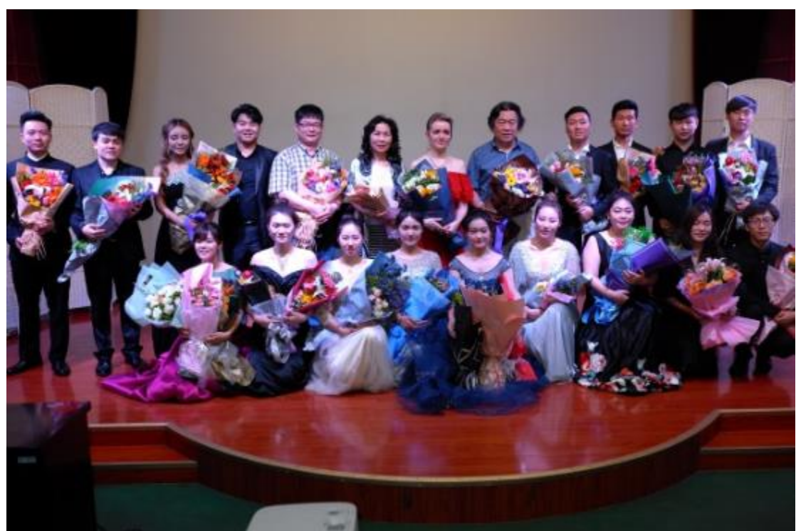
受邀參與鄭州大學音樂表演專業中白合作辦學項目告別音樂會