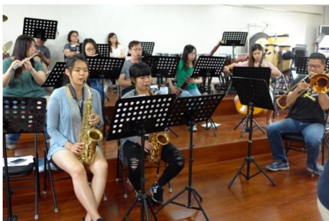
個別上課與團體練習