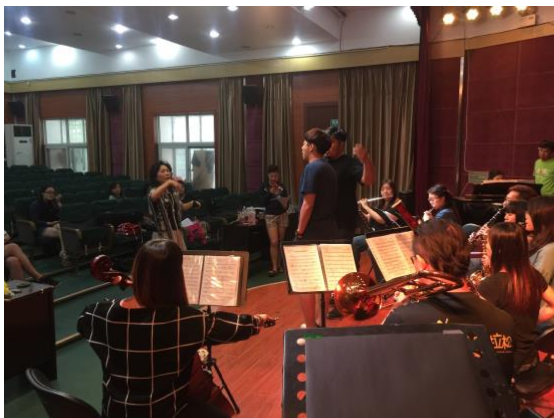
臺東大學與鄭州大學聯合交流音樂會總彩排