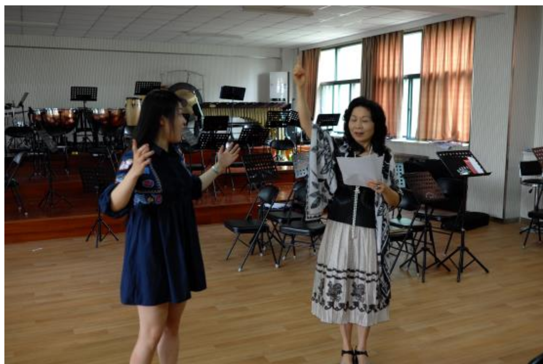
與鄭州大學互換主修教師交流上課