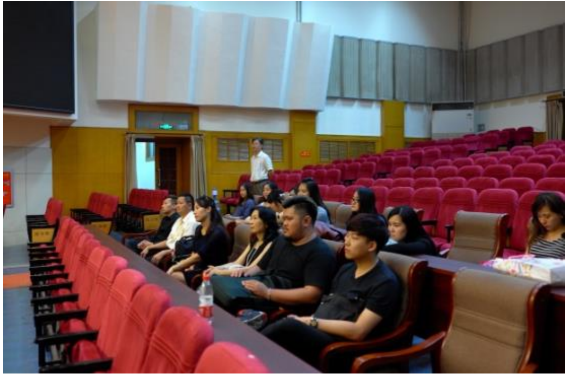
拜會河南大學及碩士生相互交流