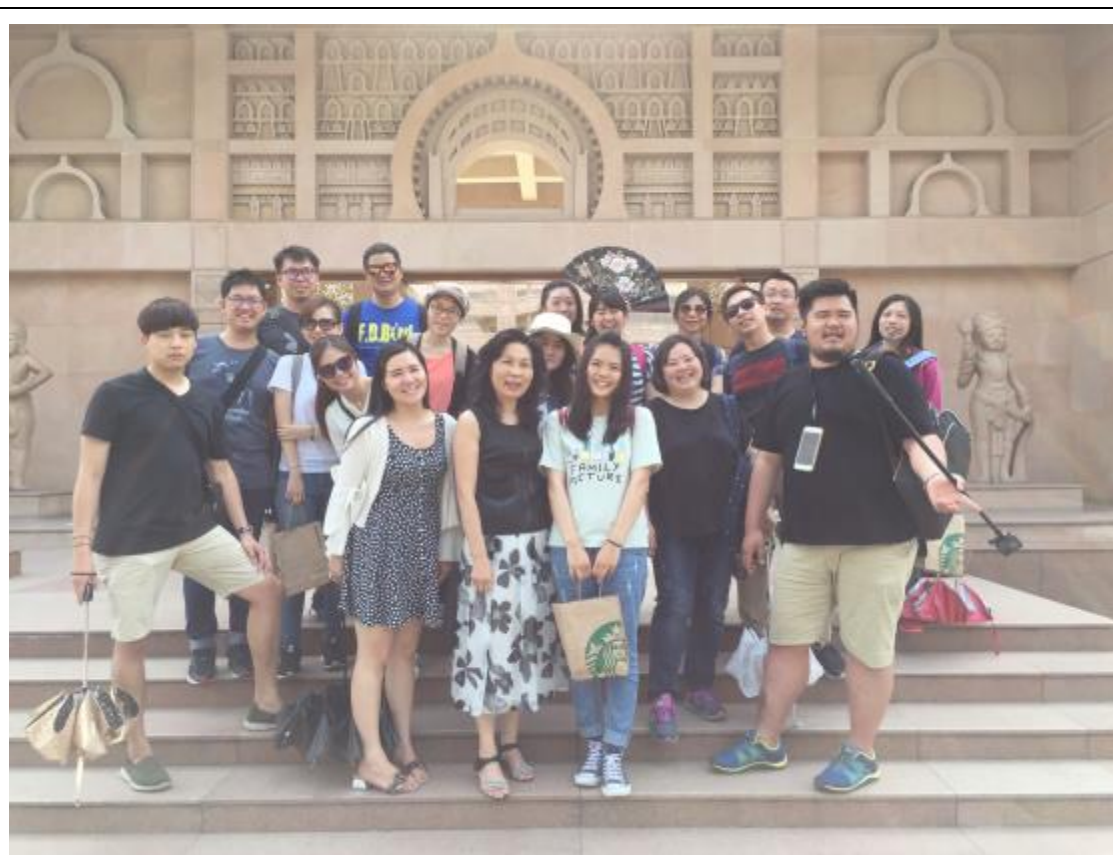
參觀洛陽白馬寺合影