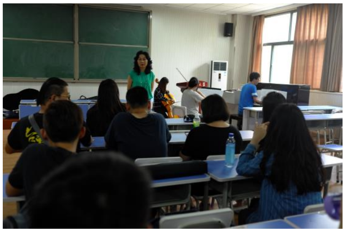
上課與分組報告討論