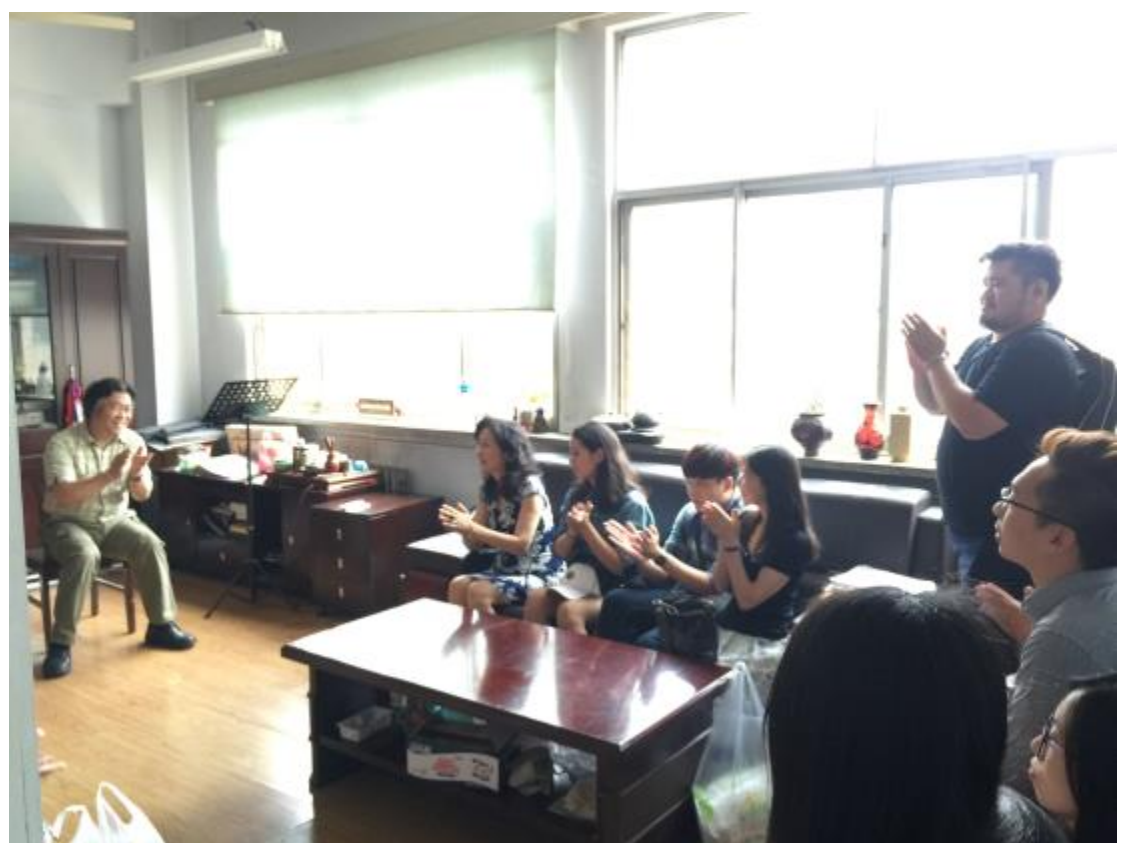
台東大學音樂系碩士班感謝鄭州大學音樂學院鞏院長 & Say Good Bye~