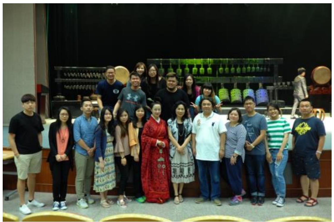
音樂系師生與華夏古樂團交流及互動