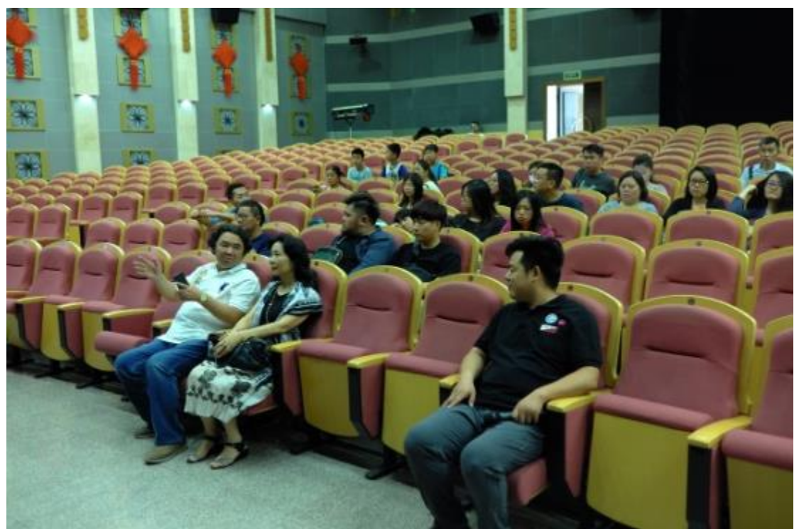
音樂系師生與華夏古樂團交流及互動