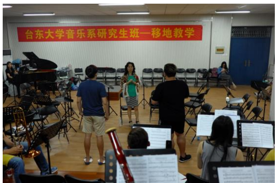
臺東大學與鄭州大學聯合交流音樂會第一次彩排