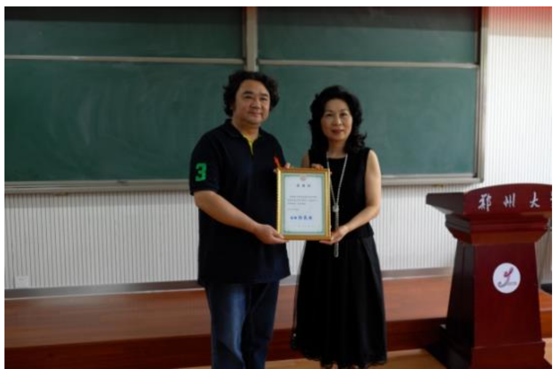
臺東大學音樂系碩士班移地教學開班典禮，致贈台東大學校旗與感謝狀