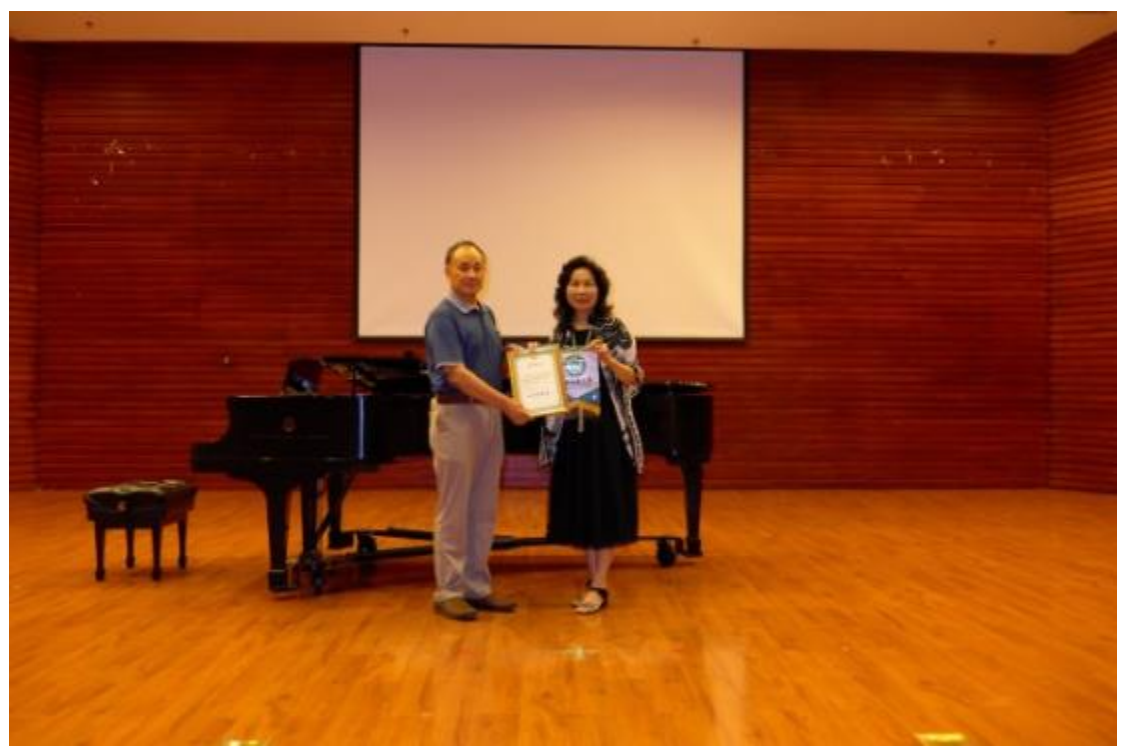
拜會鄭州大學西亞斯國際學院並致贈校旗及感謝狀