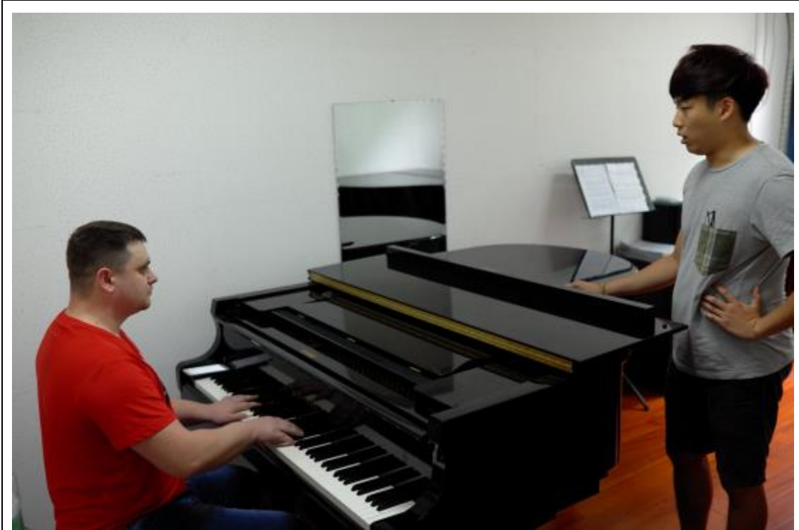
鄭州大學俄羅斯主修教師交流上課