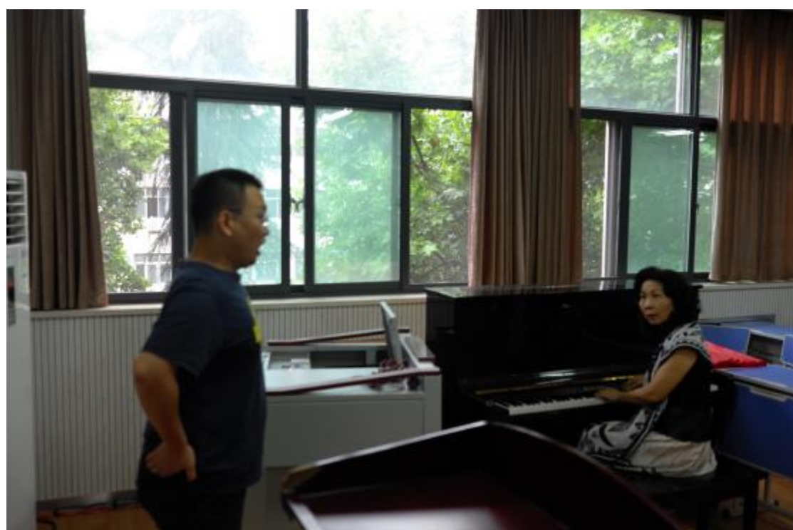
郭美女主任親自指導聲樂課程