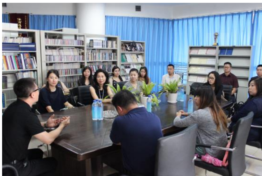
拜會鄭州大學西亞斯國際學院與交流座談