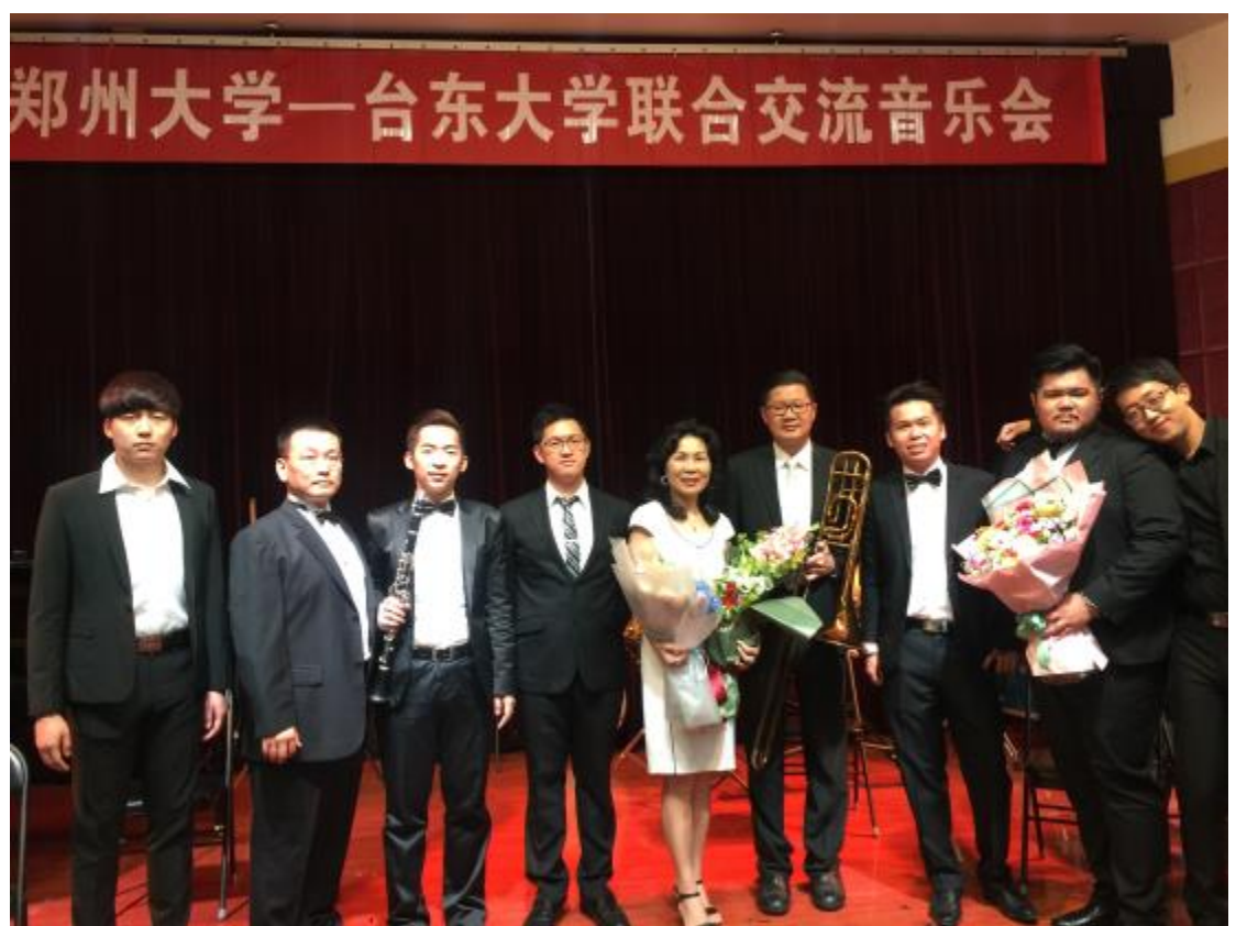
臺東大學與鄭州大學聯合交流音樂會圓滿成功大合影