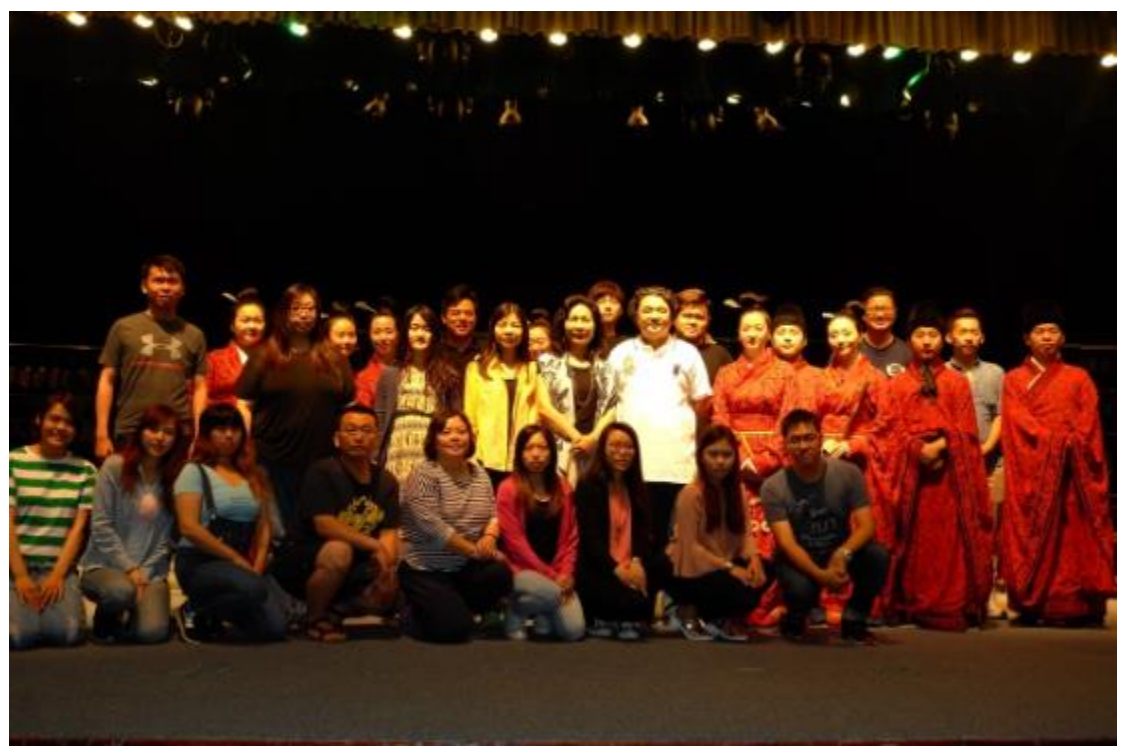
音樂系師生與華夏古樂團交流及合影