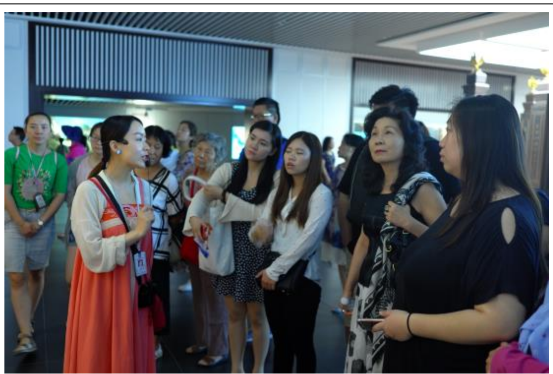
參觀洛陽天堂、明堂