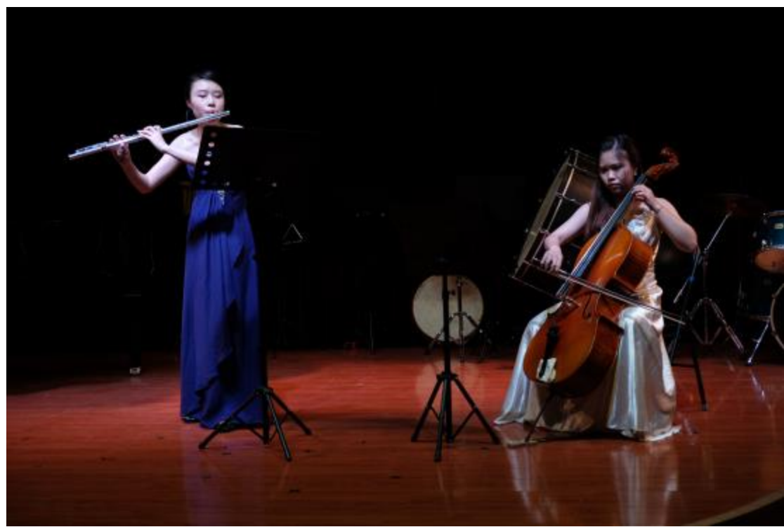
臺東大學與鄭州大學聯合交流音樂會正式演出