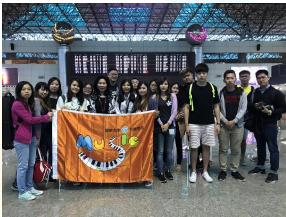
出發前往鄭州大學