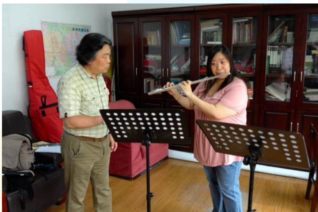
鄭州大學鞏院長親自上課指導