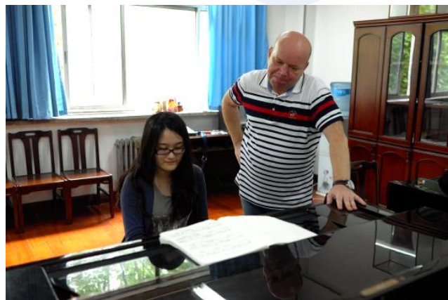
鄭州大學俄羅斯鋼琴主修教師交流上課