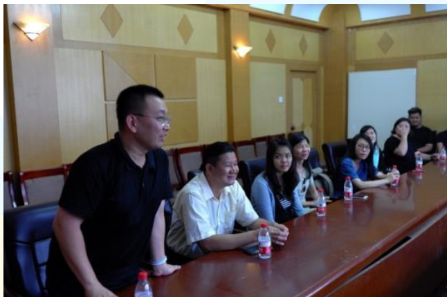
拜會河南大學及碩士生相互交流