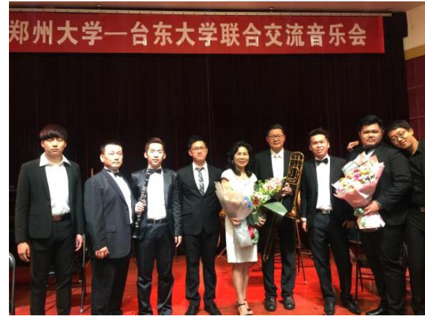
臺東大學與鄭州大學聯合交流音樂會 圓滿成功大合影