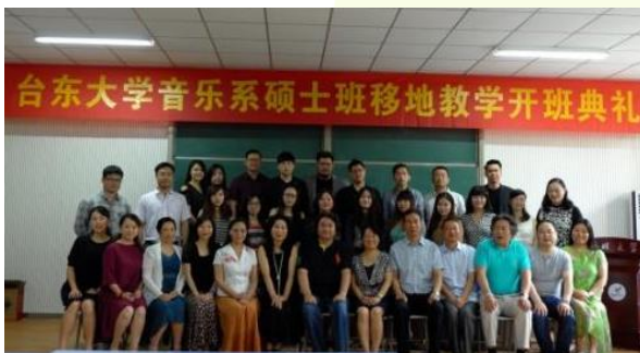
台東大學音樂系碩士班 移地教學開班典禮