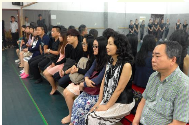
參觀河南師範大學上課情形