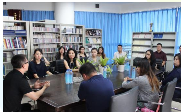
拜會鄭州大學西亞斯國際學院 與交流座談