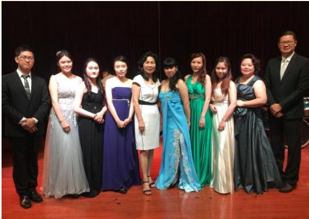
臺東大學與鄭州大學聯合交流音樂會 圓滿成功大合影