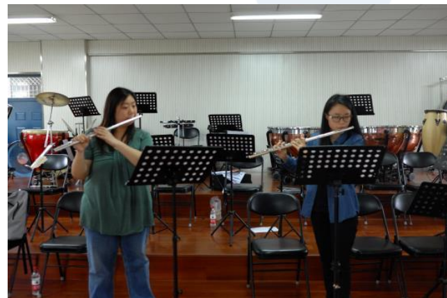
個別上課與團體練習