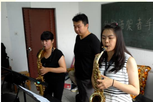
與鄭州大學互換主修教師交流上課