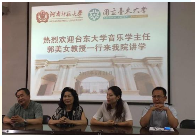
拜會河南師範大學與交流座談