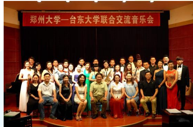
臺東大學與鄭州大學聯合交流音樂會 圓滿成功大合影