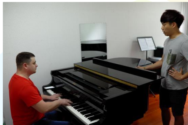
鄭州大學俄羅斯主修教師交流上課