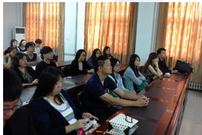
拜會河南師範大學與交流座談