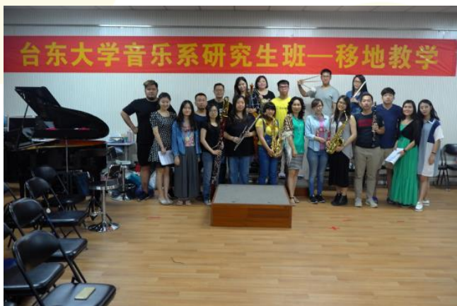
臺東大學與鄭州大學聯合交流音樂會 第一次彩排合影