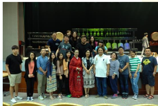
音樂系師生與華夏古樂團交流及互動